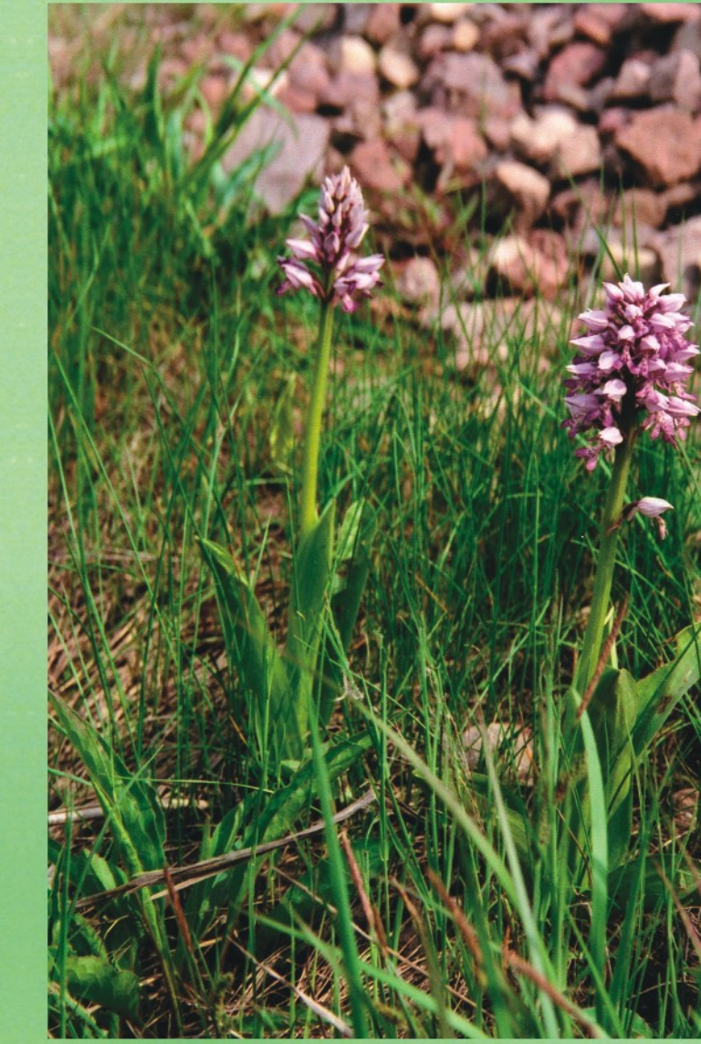
Bruņcepuru dzegužpuķe Orchis militaris