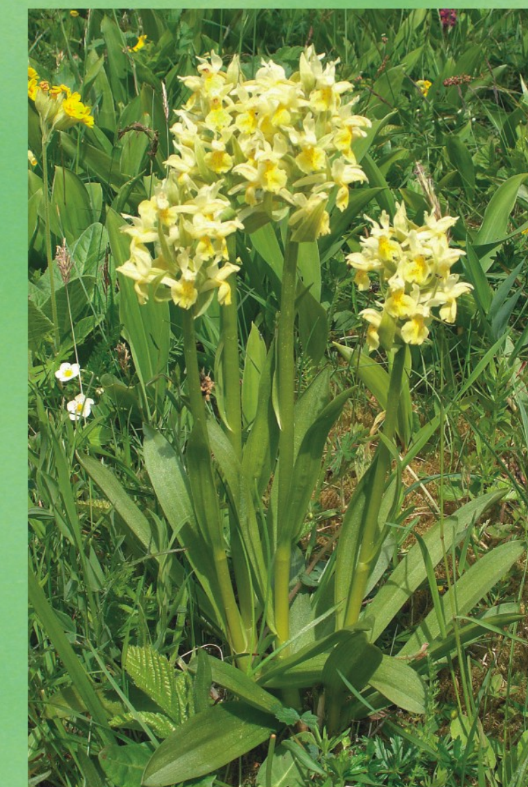
Iedzeltenā dzegužpirkstīte Dactylorhiza ochroleuca