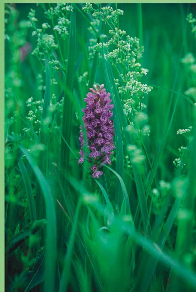
Baltijas dzegužpirkstīte Dactylorhiza baltica