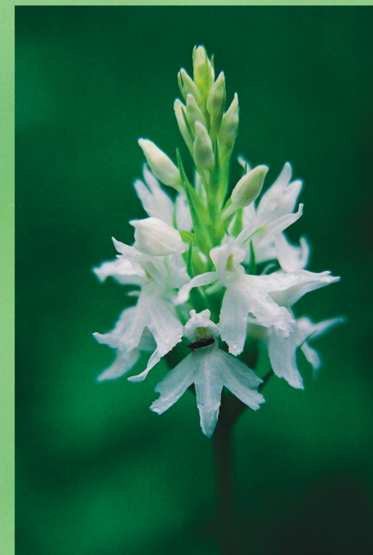
Fuksa dzegužpirkstīte (baltziedu forma) Dactylorhiza fuchsii f. alba