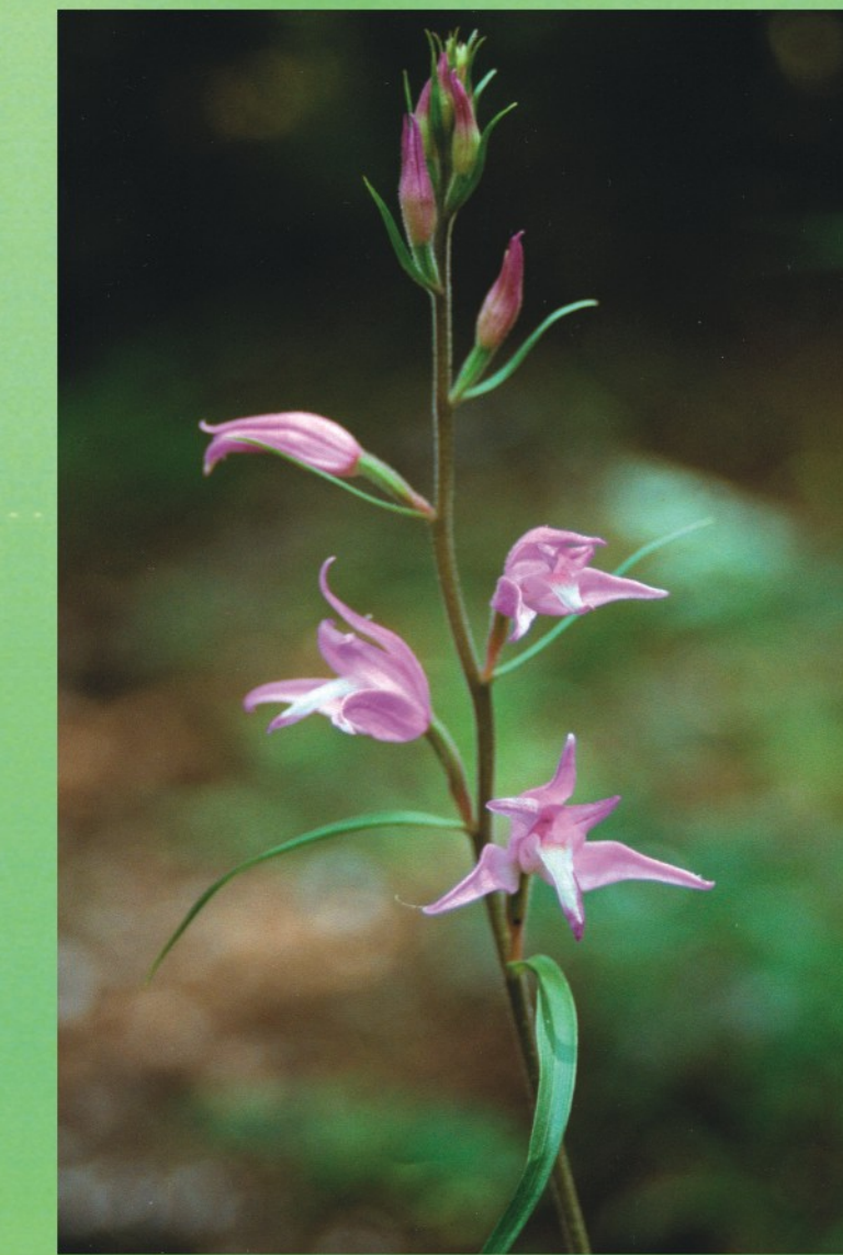
Sarkanā cefalantēra Cephalanthera rubra