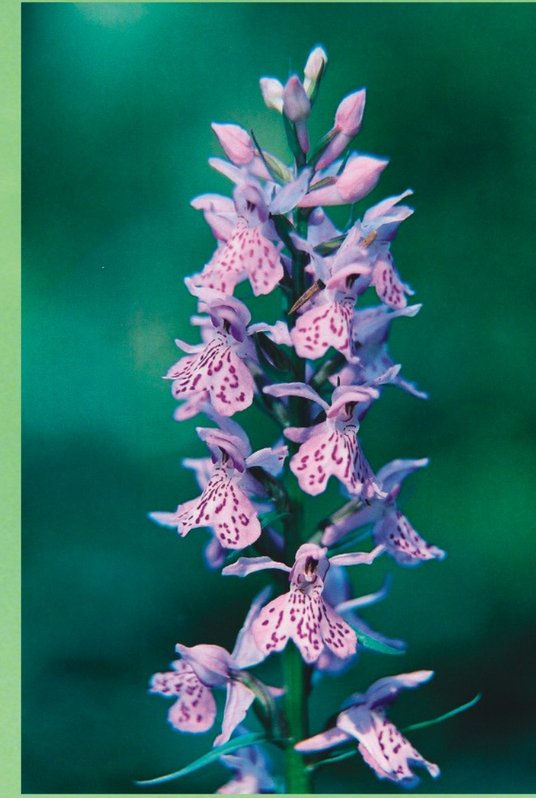
Plankumainā dzegužpirkstīte Dactylorhiza maculata