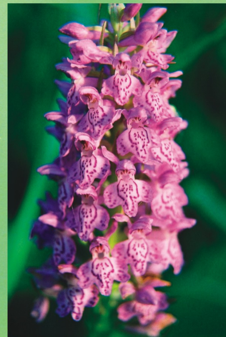
Baltijas dzegužpirkstīte Dactylorhiza baltica