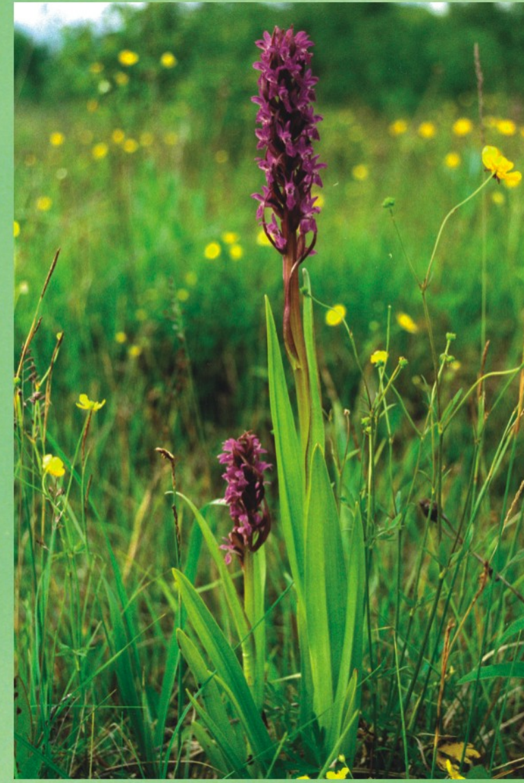
Stāvlapu dzegužpirkstīte Dactylorhiza incarnata