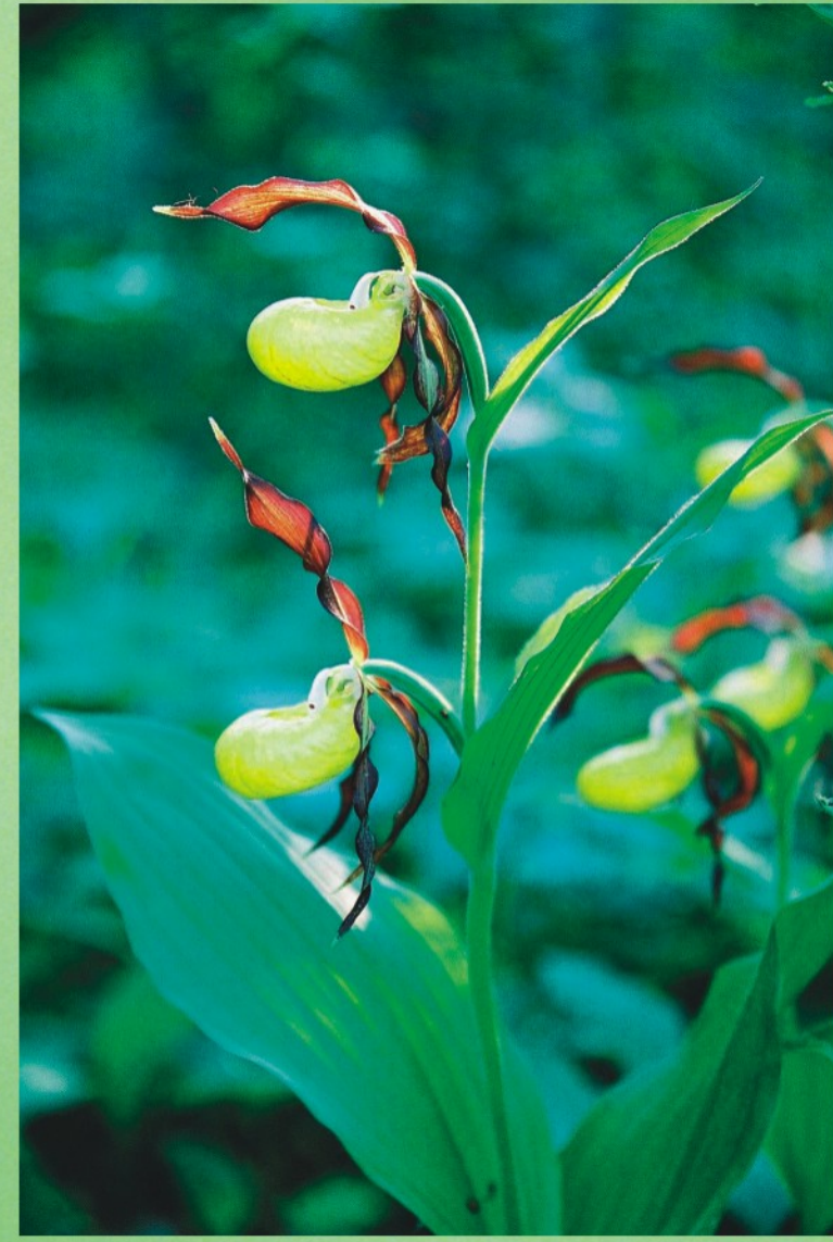
Dzeltenā dzegužkurpīte Cyprinedium calceolus