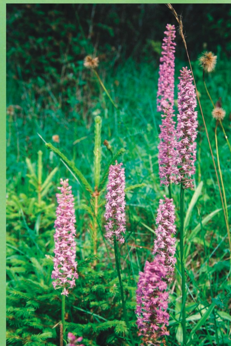
Odu gimnadēnija Gymnadenia conopsea