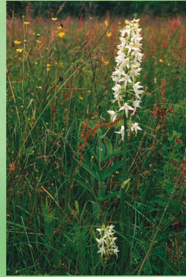
Smaržīgā naktsvijole Platanthera bifolia