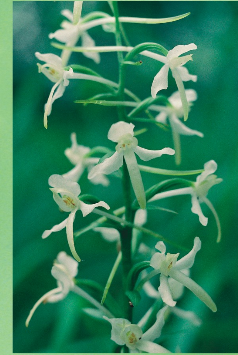
Smaržīgā naktsvijole Platanthera bifolia