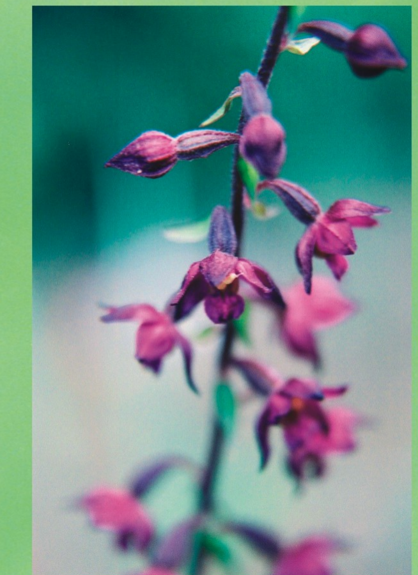
Tumšsarkanā dzeguzene Epipactis atrorubens

NEPIEĻAUSIM, ka no mūsu zemes izzūd šie brīnumainie augi – orhidejas!