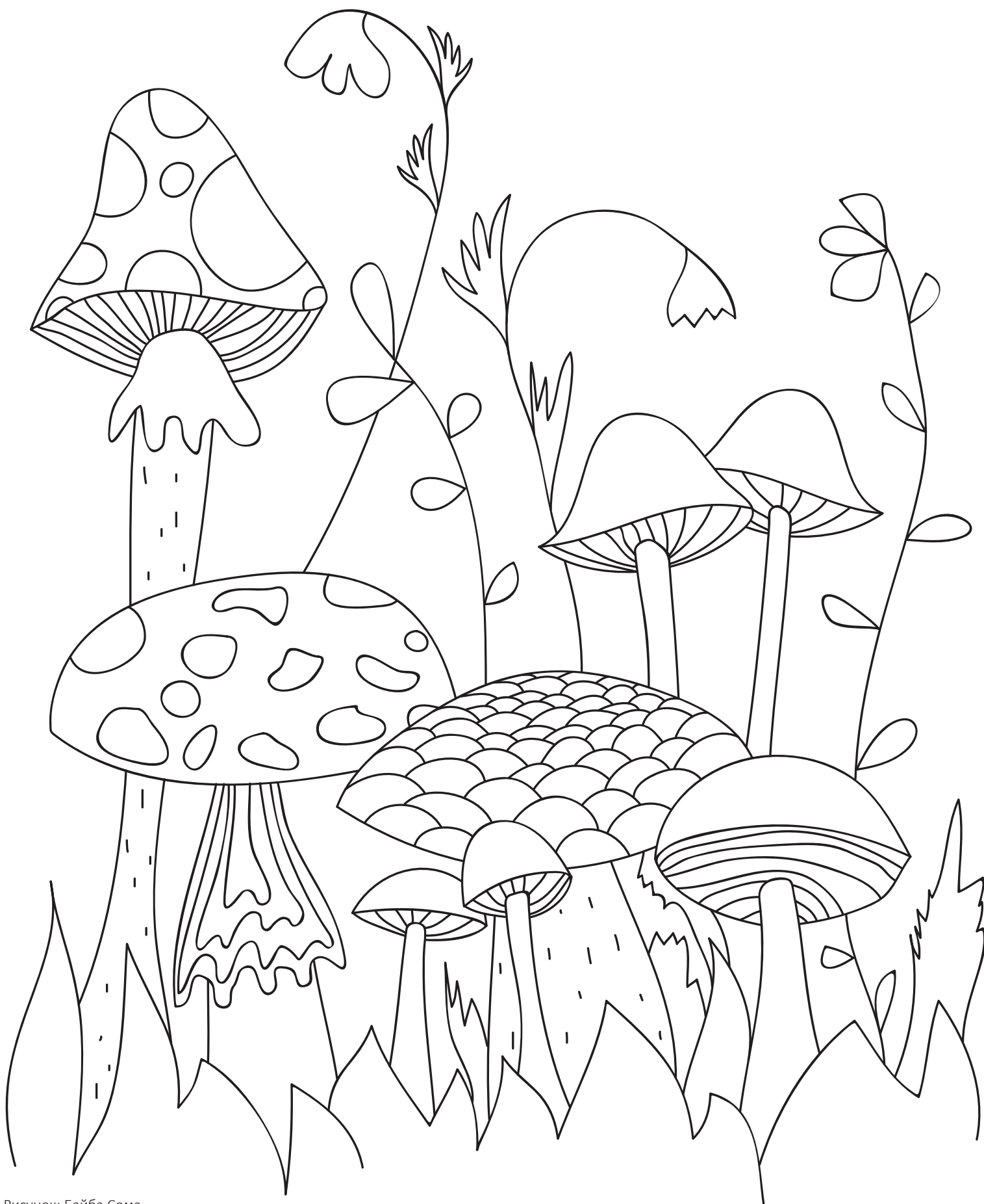
Рисунок: Байба Сона