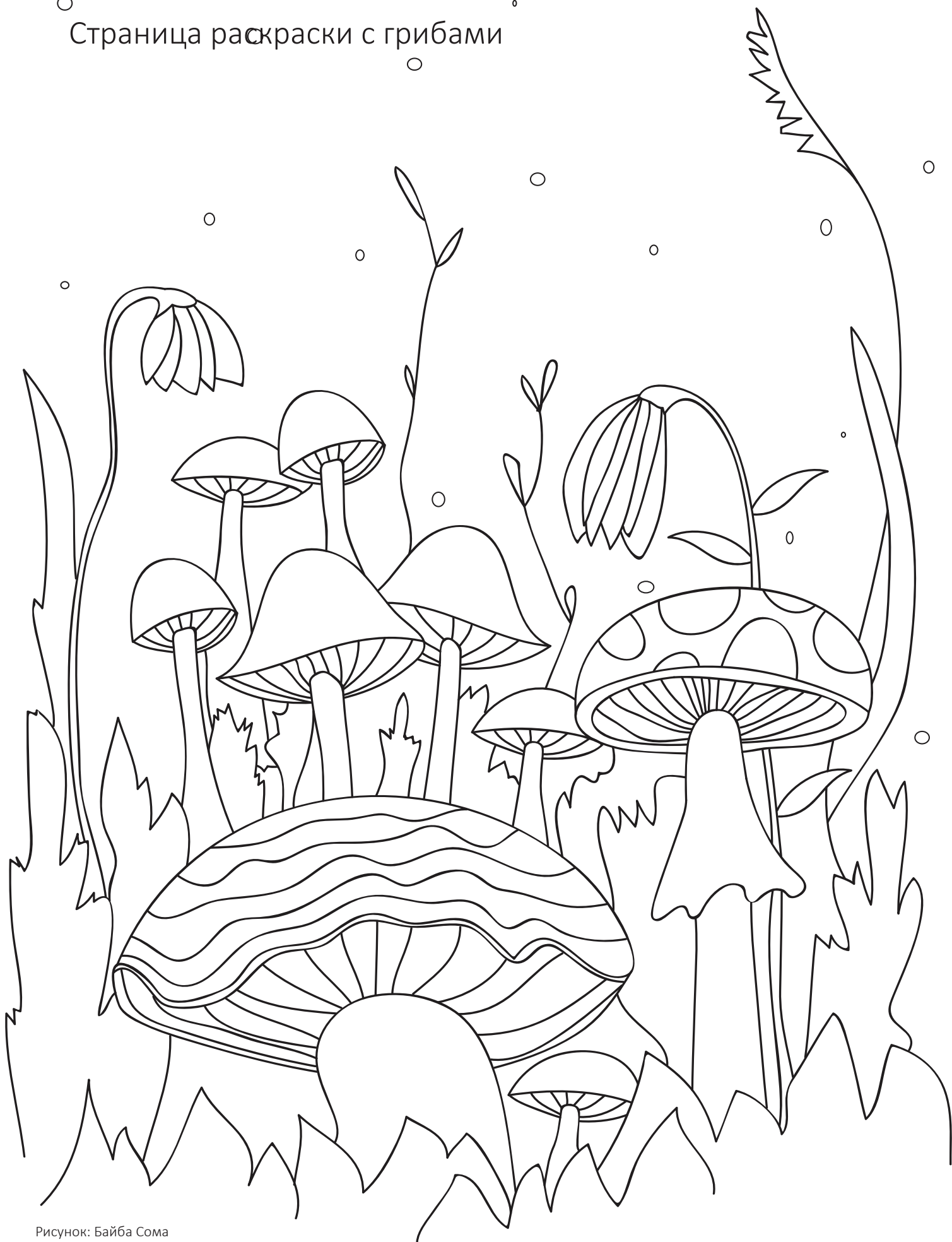
Рисунок: Байба Сом