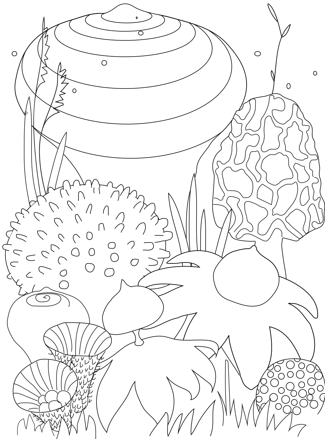
Рисунок: Байба Сом