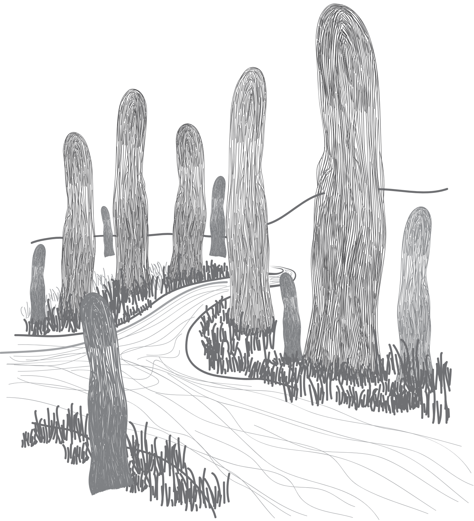
Рисунок: Байба Сома