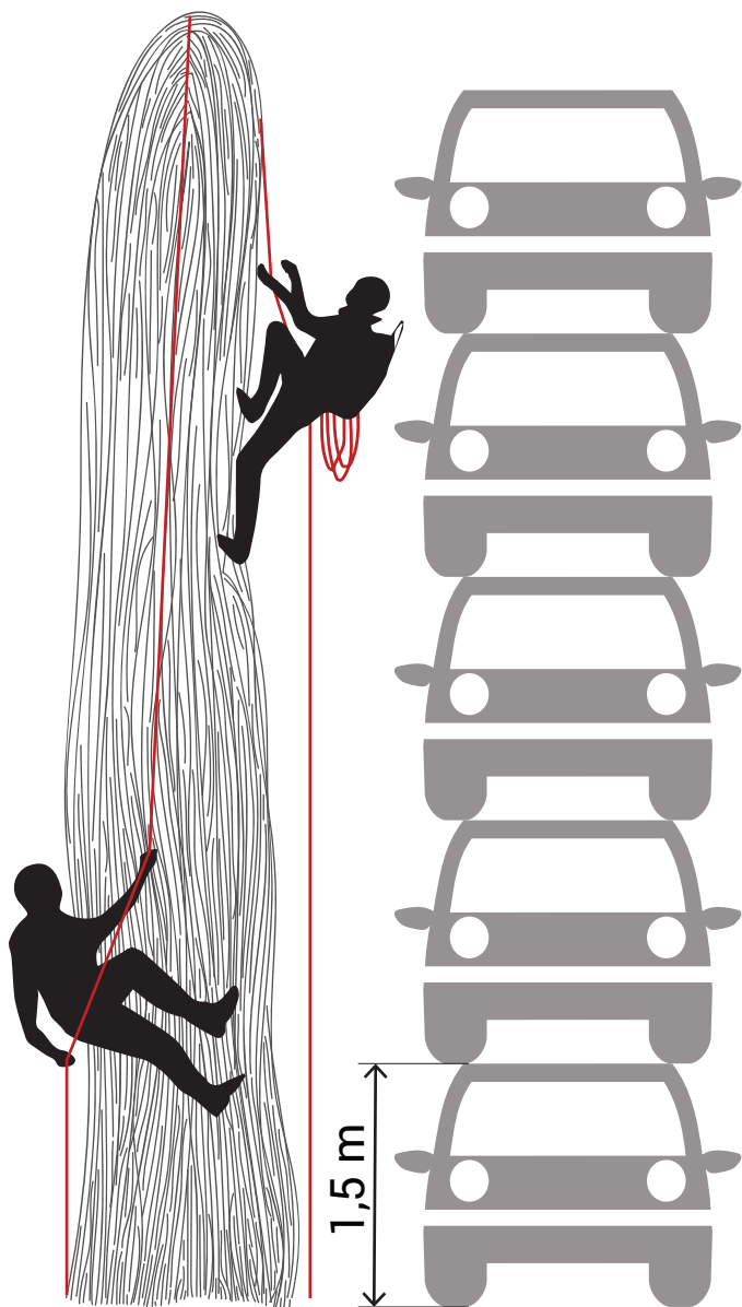
Рисунок: Байба Сона

Так или иначе, видимые и невидимые, грибы были до нас, они рядом с нами сейчас, и наверное будут здесь и тогда, когда человек поселится на других планетах.