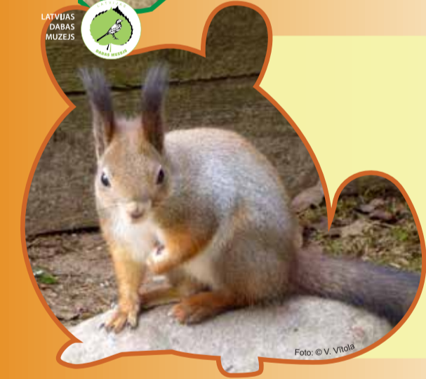
LATVIJAS DABAS MUZEJS