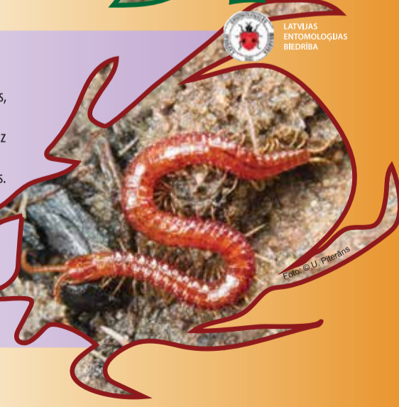
LATVIJAS ENTOMOLOGU BIEDRĪBA