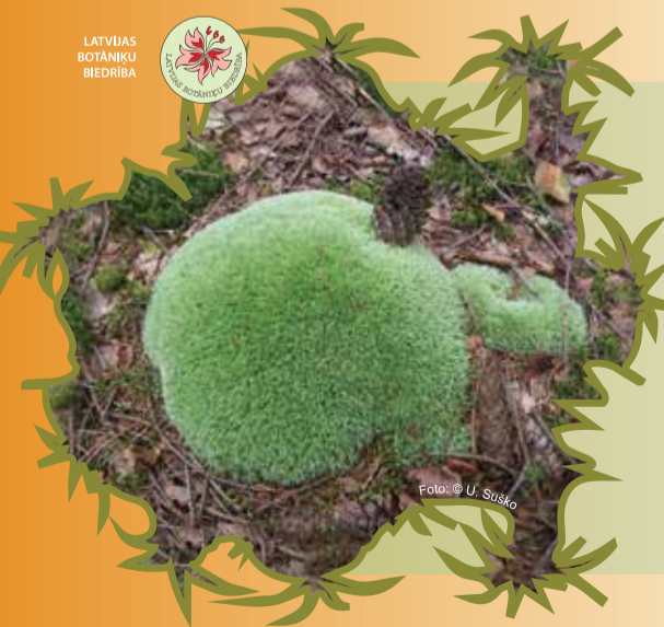
LATVIJAS BOTĀNIKU BIEDRĪBA