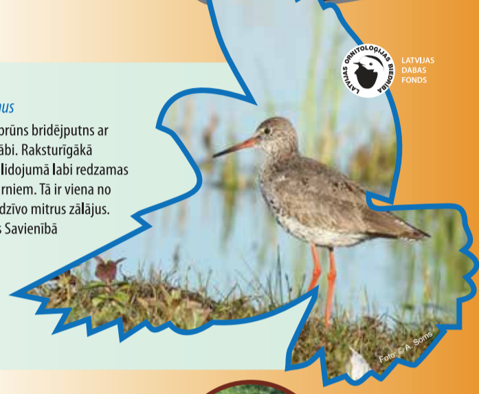
LATVIJAS ENTOMOLOGU BIEDRĪBA