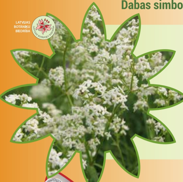
LATVIJAS BOTĀNIKU BIEDRĪBA

Simtkāja posmā ķermeni klāj biezi bruņots apvalks, kas pēc krāsojuma atgādina Baltijas jūras dzintaru. Brūnganā krāsā. Simtkājiem ir pēc skaita trīsdesmit līdz pat vairākiem simtiem eņķāju. Pie katra ķermeņa posma ir piestiprināts viens, sāniski vērsti eņķāju pāris. Pateicoties šim eņķājiem, simtkāji spēj prasmīgi ložņāt savā dabiskajā dzīves vidē – augsnes virskārtā zem dažādiem patvērumiem. Daļēji saplacinātais ķermenis ļauj izlist cauri dažādām maza izmēra spraugām, kā arī veikli meklēt barību – citas par sevi mazākus augsnes virskārtā dzīvojošas radības.