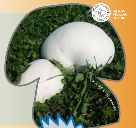
LATVIJAS MIKOLOGU BIEDRĪBA