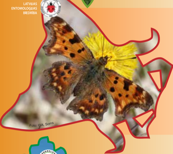
LATVIJAS ENTOMOLOGU BIEDRĪBA