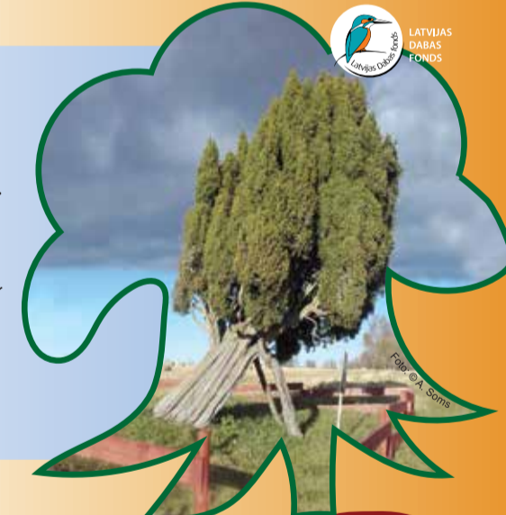
LATVIJAS DABAS FONDS