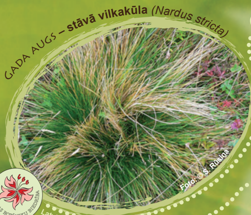
GADA AUGS - stāvā vilkakūla ( Nardus stricta )

Latvijā samērā bieži sastopama, bet necilā izskata dēļ neievērojama, tādēļ reti kurš to pazīst. Stāvā vilkakūla ir neliels graudzāļu dzimtas augs ar blīvu ceru, sarveidīgām, raupjām lapām, kas atgādina vilka kažoka asos akotmatus. Noziedējusi vilkakūlas ziedkopa atgādina ķemmi. Vilkakūla spēj augt īpaši nabadzīgās augsnēs, tā ir apbrīnojami izturīga un spītīga. Vilkakūlas zālāju platības sarūk, tāpēc visā Eiropas Savienībā tie ir iekļauti aizsargājamo biotopu sarakstā. Ja tā aug jūsu pļavā vai ganībās, tad jāatrod vēl vismaz divas indikatoraugus, un varat droši teikt, ka tas ir dabisks zālājs.