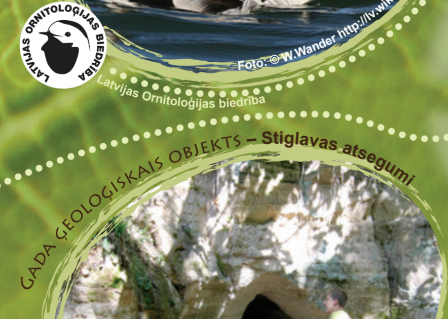
GADA ĢEOLOĢISKAIS OBJEKTS - Stiglavas atsegumi

Vienīgais bruņrupuču kārtas pārstāvis Latvijā. Šis dzīvnieks pie mums ir ļoti rets, bruņrupucis sastopams atsevišķās vietās Latgalē, Zemgalē un Kurzemē. Tas ir neliela izmēra bruņrupucis, kuram muguras bruņa ir tumši pelēkā vai melnā krāsā ar sīkiem dzeltenīgiem, dzeltenīgi baltiem plankumiem. Starp priekškāju un pakājkāju pirkstiem ir peldplēve. Tēviņi no mātītēm atšķiras ar garāku, resnāku asti, kā arī tiem acs varavīksnene ir sarkanīgi brūnā krāsā. Pārtiek no abiniekiem, zivīm un ūdens bezmugurkaulniekiem.