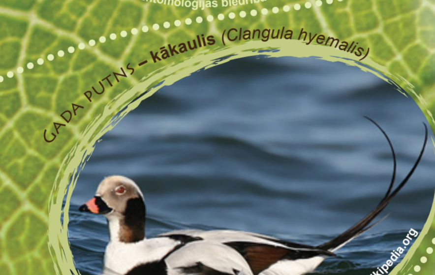
GADA PUTNIS - kākaulis ( Clangula hyemalis ) Foto: © W. Wander http://lv.wikipedia.org Latvijas Ornitoloģijas biedrība

Kukaiņu parazīts, kas bieži sastopams visos Latvijas iekšējos ūdeņos, kurus apdzīvo kukaiņi. Matoni jeb zirga mati pieder atsevišķam dzīvnieku tipam Nematomorpha , kas tulkojumā no grieķu valodas nozīmē diegveidīgie. Iztraucēti matoni izloka ķermeni un pat sasniedz mezglā. Pieaugušus matonus var novērot lēni peldam ūdenī. Parasti to garums ir 10-15 cm, ķermeņa diametrs nepārsniedz 1 mm. Matoni daudziem cilvēkiem izraisa bailes un nepatiku, taču cilvēkam tie ir nekaitīgi, jo parazītē dažādos kukaiņos.