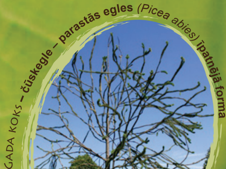
GADA KOKS - čūskegle - parastās egles ( Picea abies ) īpatnējā forma

Ik gadu atgādina par dabas elementiem, kas prasa īpašu uzmanību.