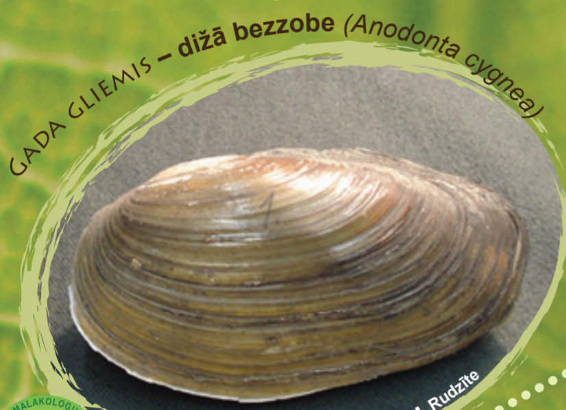
GADA GLIEMIS - dižā bezzobe ( Anodonta cygnea )

Parastās egles formas ar īpatnēji izlocītiem un mazzarotiem dzinumiem - tā sauktās čūskegles. Tās ir dažādām egļu sugām dabā atrastas formas, kuru savdabīgais, skrajais zarojums ar parupjām skujām atgādina izlocījušos čūsku. Pazīstamākās čūskeglu šķirnes - Virgata un Viminalis var iegādāties Latvijas stādu audzētavās. Ievērojama čūskeglu kolekcija atrodas Nacionālajā botāniskajā dārzā un Latvijas Valsts mežu arborētumā Kalsnavā.