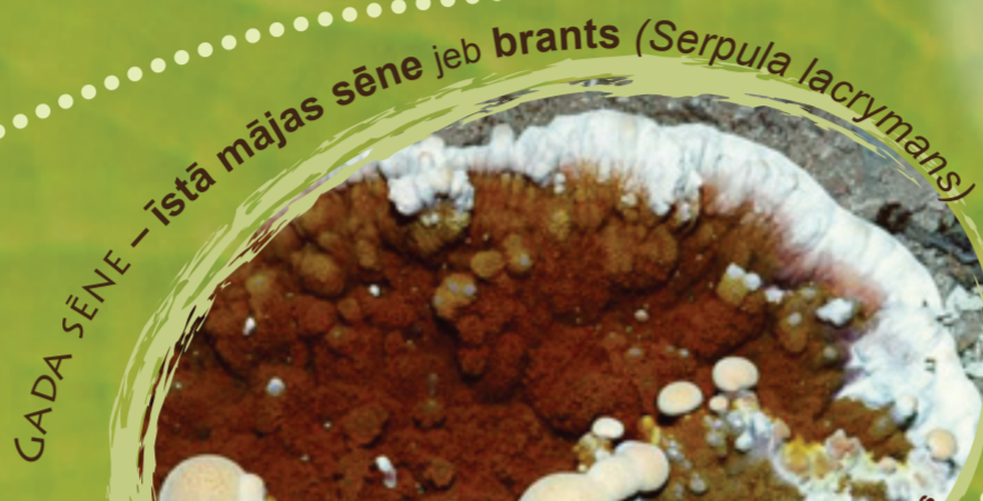
GADA SĒNE - istā mājas sēne jeb brants ( Serpula lacrymans )

Latvijā samērā bieži sastopama, bet necilā izskata dēļ neievērojama, tādēļ reti kurš to pazīst. Stāvā vilkakūla ir neliels graudzāļu dzimtas augs ar blīvu ceru, sarveidīgām, raupjām lapām, kas atgādina vilka kažoka asos akotmatus. Noziedējusi vilkakūlas ziedkopa atgādina ķemmi. Vilkakūla spēj augt īpaši nabadzīgās augsnēs, tā ir apbrīnojami izturīga un spītīga. Vilkakūlas zālāju platības sarūk, tāpēc visā Eiropas Savienībā tie ir iekļauti aizsargājamo biotopu sarakstā. Ja tā aug jūsu pļavā vai ganībās, tad jāatrod vēl vismaz divas indikatoraugus, un varat droši teikt, ka tas ir dabisks zālājs.