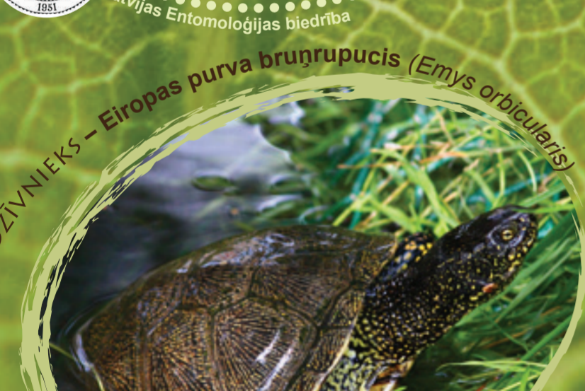
GADA DZĪVNIĒKS - Eiropas purva bruņrupucis ( Emys orbicularis )

Kākaulis ir pīle, kas ligzdo tundrā, bet laikā no novembra līdz maijam uzturas Baltijas jūrā. Pavasarī daudzviet jūrā dzirdams „kā-kau-lit, kā-kau-lit”. Tur kākaulis sauc savu vārdu. 2012. gadā kākaulis atzīts par globāli apdraudētu sugu. Tam par pamatu ir kākauļu skaita samazināšanās Baltijas jūrā par 65% pēdējo 16 gadu laikā. Kākauļa dzīves veids ir tik cieši saistīts ar jūras vidi, ka tā populācijas stāvokli var uzskatīt par vienu no rādītājiem Baltijas jūras kopējām stāvoklim, un šobrīd šis rādītājs neliecina neko labu.