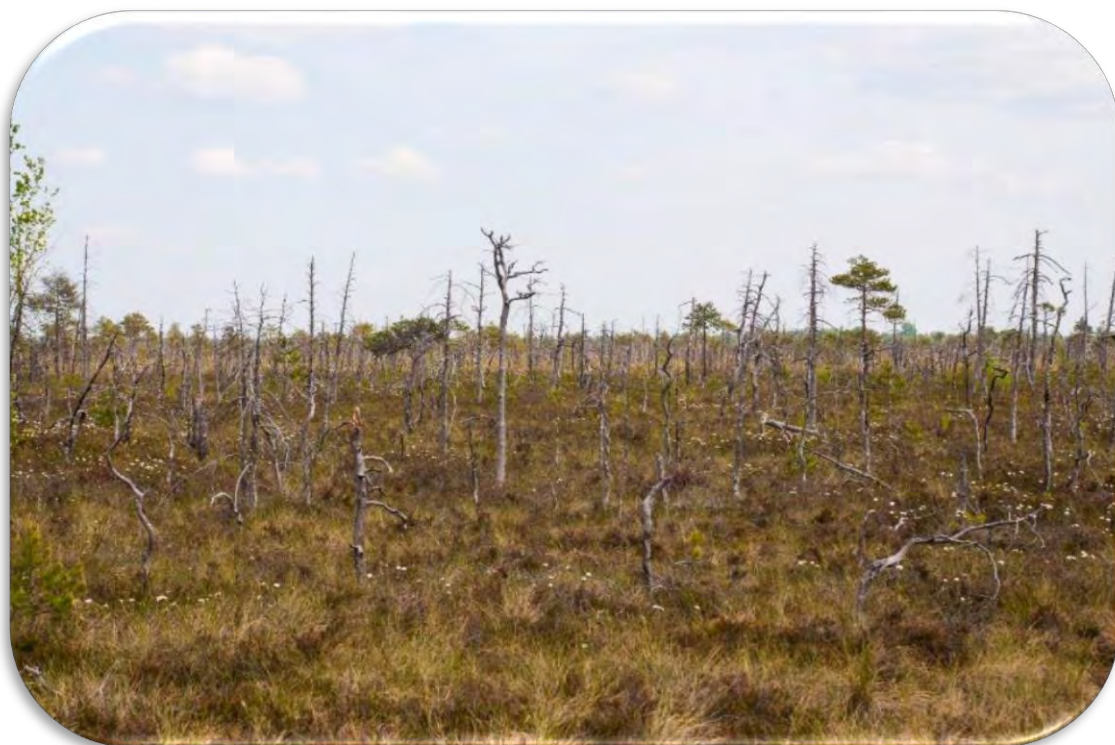
Degums augstajā purvā. Ciņu mikroreljefs. Šāda ainava nav uzskatāma par atklātu.