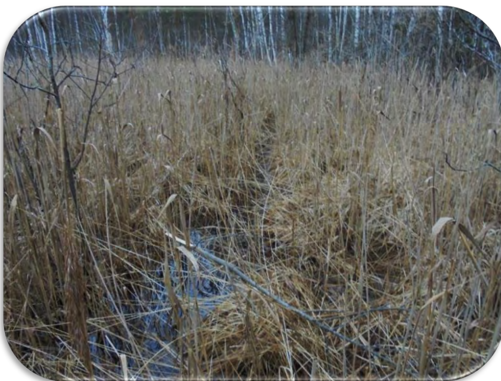
Blīvas parastās niedres Phragmites australis audzes kaļķainā zāļu purvā. Vērtē šo parametru, ja niedres veido biezas monodominantas audzes un citu augu sugu sastopamība tajās ir niecīga.