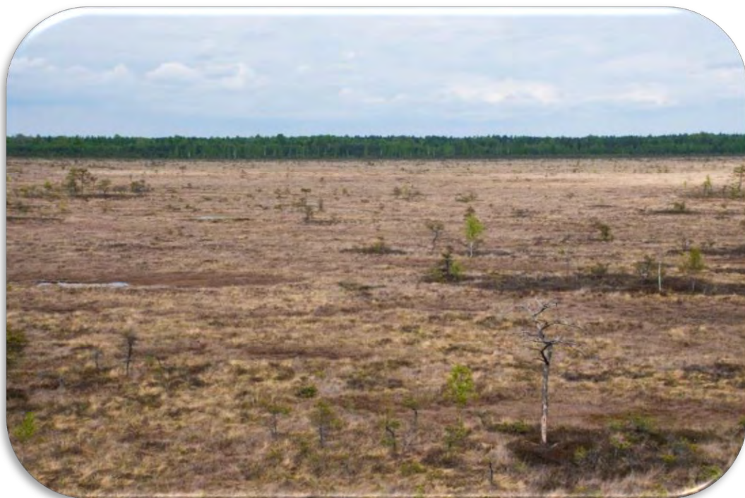
Atklāta augstā purva ainava. Ciņu-liekņu mikroreljefs Kurzēmē. Parametrs `Atklāta ainava > 5 ha` anketā jāatzīmē neatkarīgi no tās aizņemtā poligona konfigurācijas – ovāls, lineāri izstiepts u.tml.