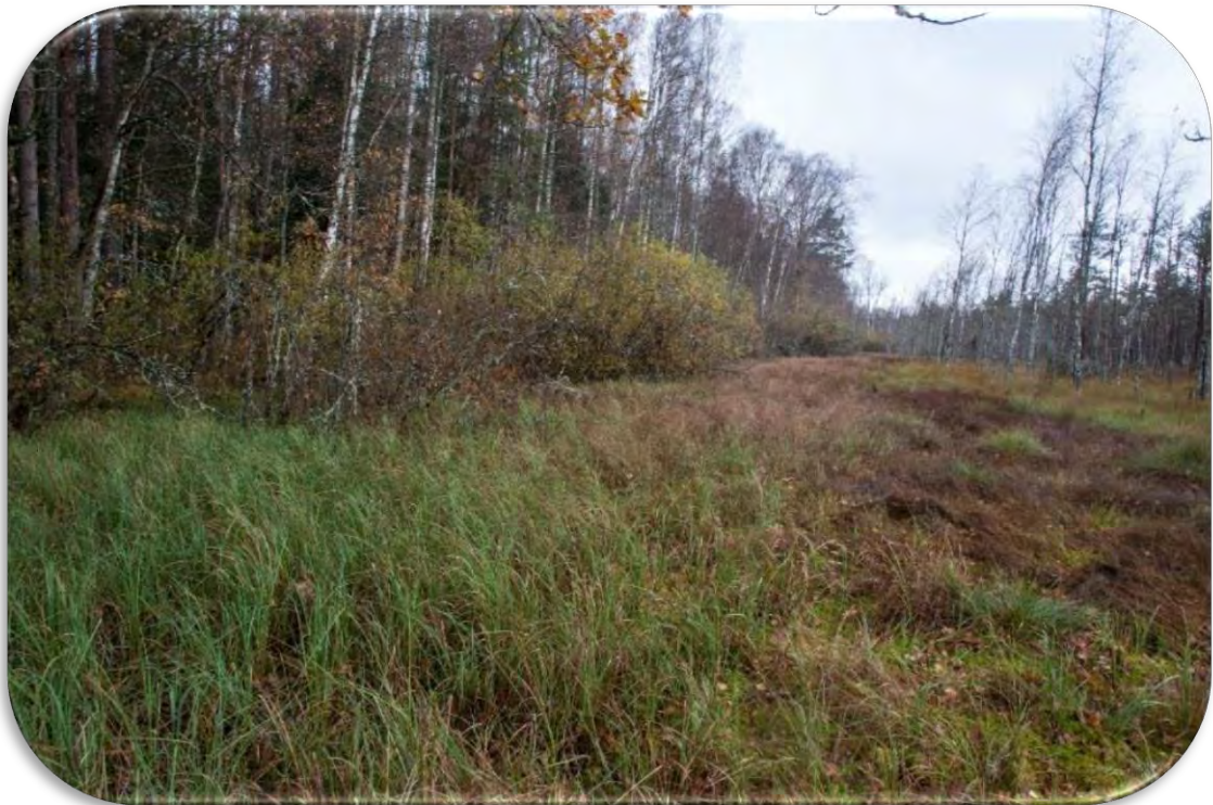
Ūdens noteces joslas/pazemes ūdeņu atslodzes vietas pie purva salas Lielajā un Pemma purvā.