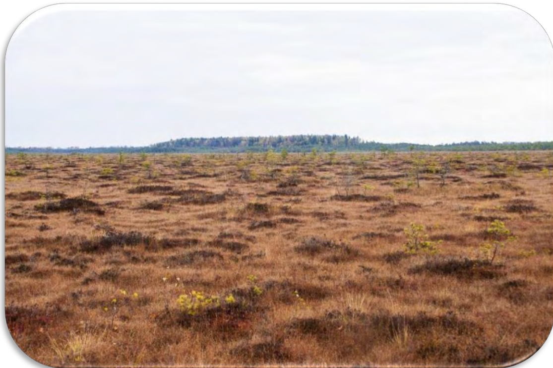
Atklāta augstā purva ainava Vidzemē. Ciņu-liekņu mikroreljefs. Parametrs `Atklāta ainava > 5 ha` anketā jāatzīmē neatkarīgi no tās aizņemtā poligona konfigurācijas – ovāls, lineāri izstiepts u.tml.