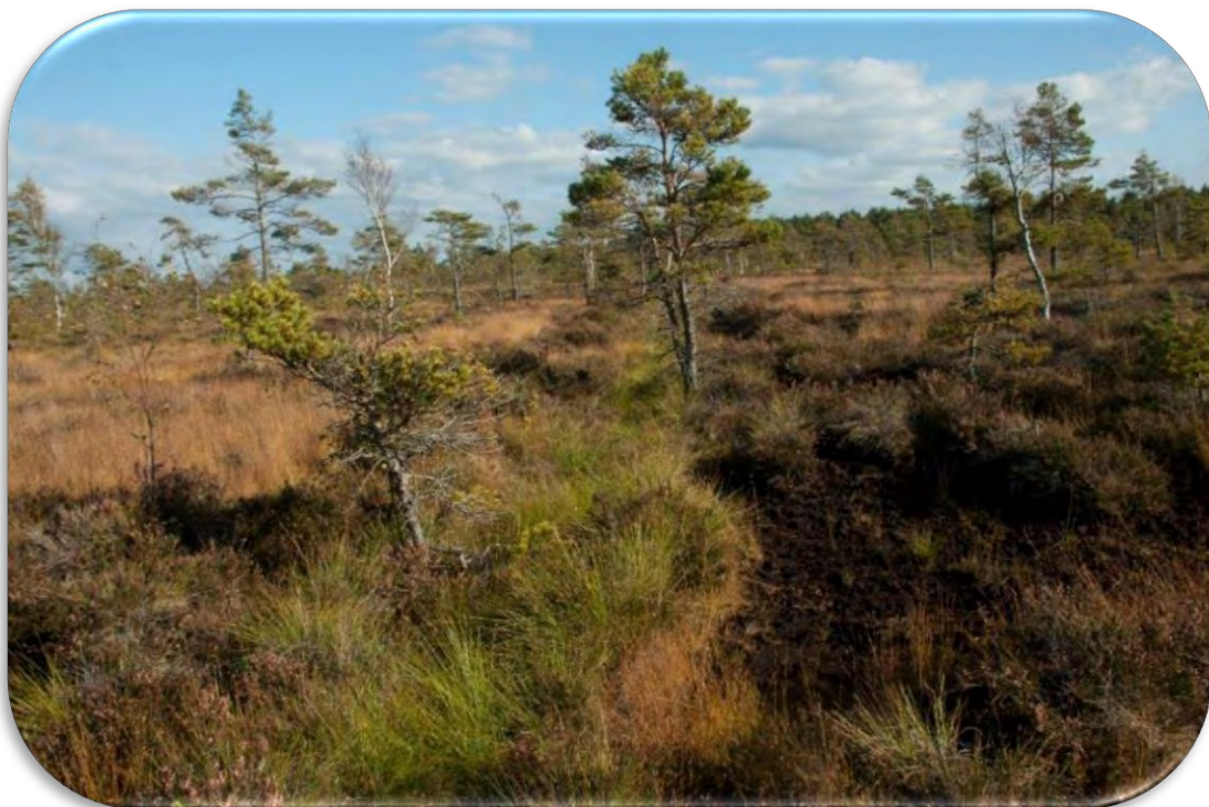
Grāvis augstajā purvā, kas anketā atzīmējams ar `A`.