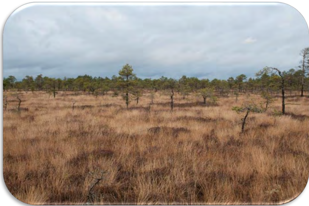
Ciņu mikroreljefs, ko veido galvenokārt ciņu mazmeldrs Trichophorum cespitosum un nedaudz sila virsis Calluna vulgaris . Sastopams galvenokārt Latvijas rietumu daļā.