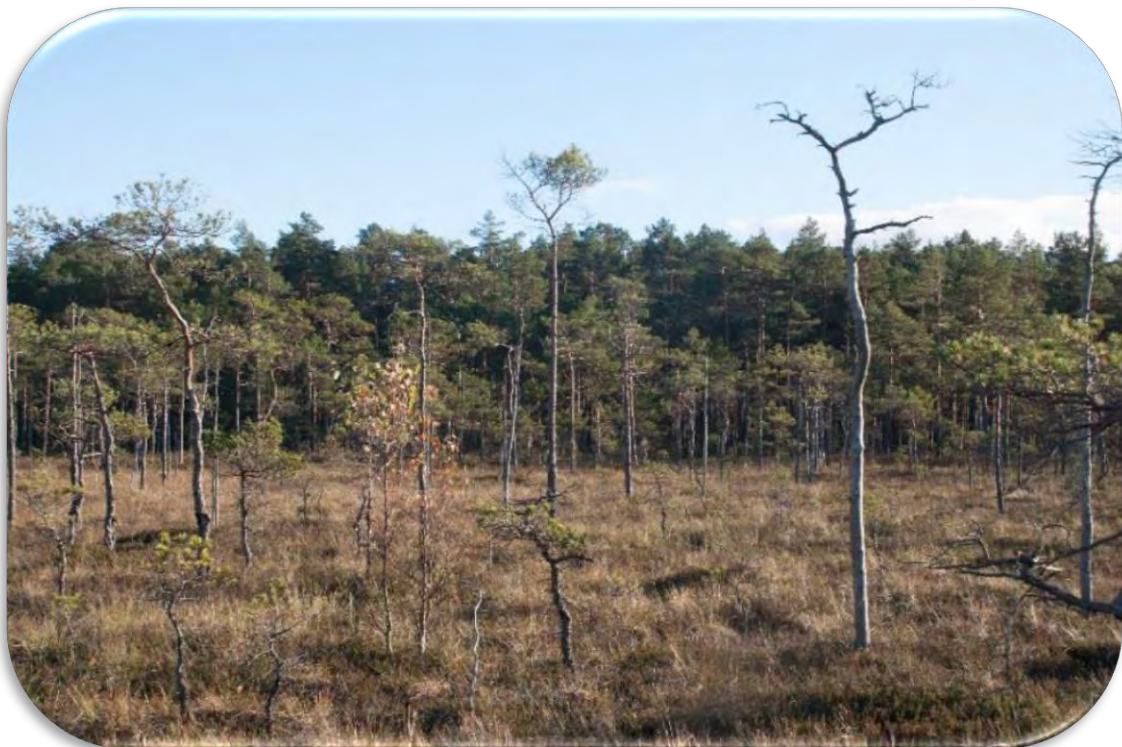
Purviem raksturīgās priedes (garās un īsās formas, attēla priekšplānā) augstajā purvā.