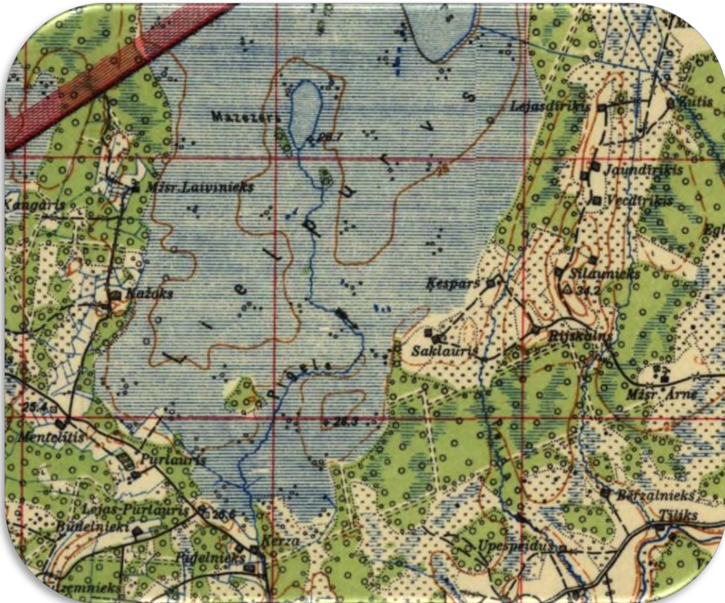
Dabiskas ūdensteces purvā labi redzamas aplūkojot kartes, aerouzņēmumus. 1929. gada topogrāfiskā karte `Aloja` M: 1: 75 000. No Oļļas (Saklauru) purva ezera iztek Pīgeles upe. Anketā šis parametrs atzīmējams arī tad, ja purvā konstatē mazākas ūdensteces. Ne vienmēr tām ir dots nosaukums.