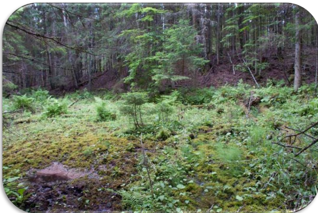
Avotu cirks.