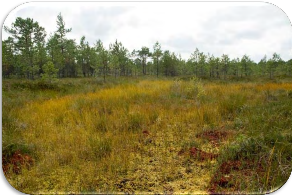
Grēdu-liekņu mikroreljefs, kur lieknā redzama lāma.