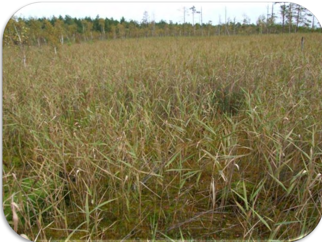
Blīvas parastās niedres Phragmites australis audzes pārejas purvā.