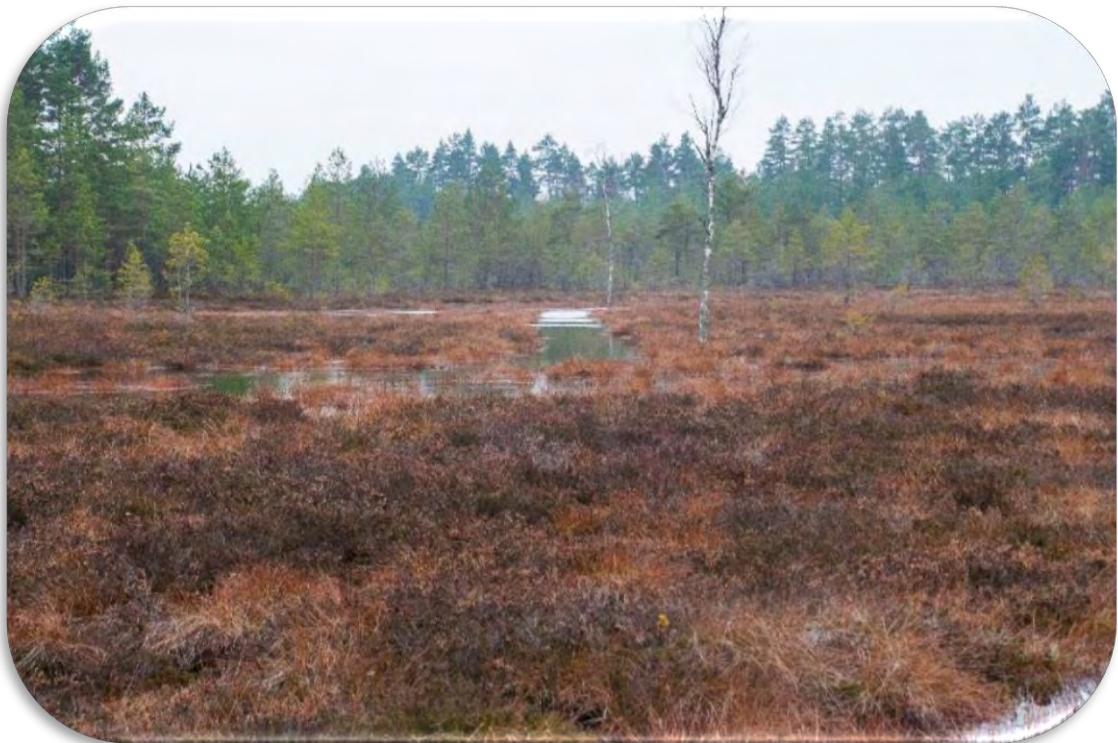
Dabiska ūdenstece augstajā purvā. Šo ūdensteci cilvēki ir taisnojuši un tā savā tecējumā vietām vairs nav likumaina, bet taisna.