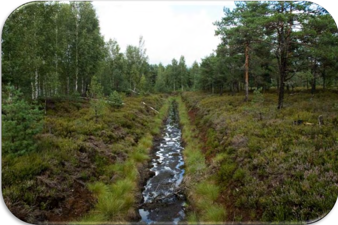
Purva kontūrgrāvis, kas anketā atzīmējams ar `C`.