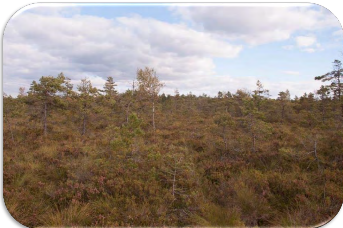
Ciņu mikroreljefs, ko veido sila virsis Calluna vulgaris un makstainā spilve Eriophorum vaginatum .

Ciņu mikroreljefs visbiežāk sastopams susināšanas ietekmētās augsto purvu daļās, purvu perifērijā, kā arī kupolos. Ciņu mikroreljefa aizņemtā platība procentos no biotopa vērtējama gan ar kokiem apaugušās, gan klajās augstā purva daļās.