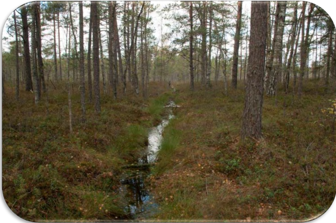
Grāvis, kas anketā atzīmējams ar `B`.