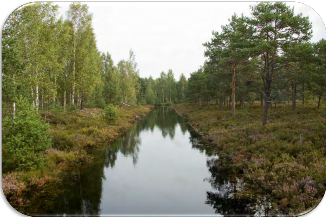
Tas pats grāvis pēc ūdens līmeņa stabilizēšanas un joprojām anketā atzīmējams ar `C`.