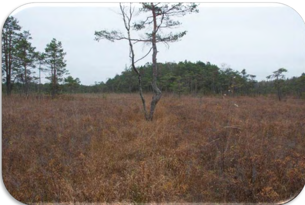
Grāvis kaļķainā zāļu purvā, kas atzīmējams anketā ar `A`. Grāvja vietu iezīmē zilganās molīnijas ciņi. Grāvja malā priede (attēla vidū).