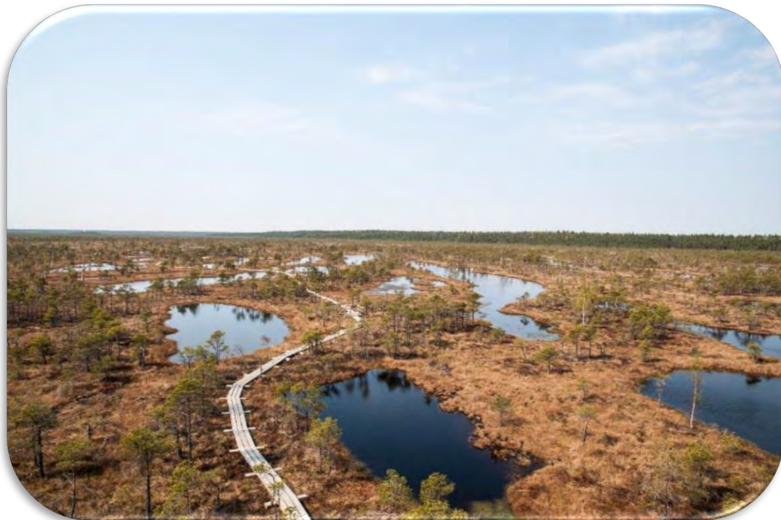
Grēdu-liekņu mikroreljefs, kur lieknās sastopami akači.