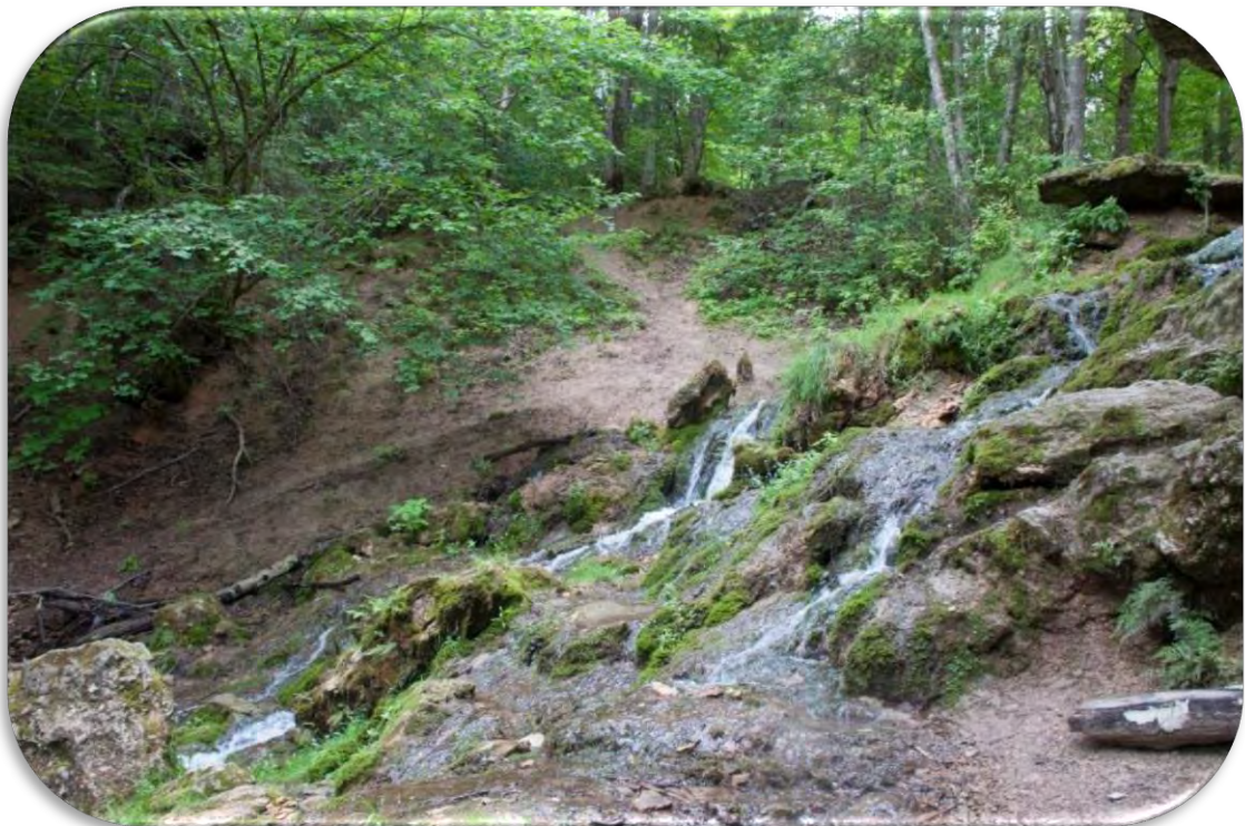
Atsegti šūnakmeņi avotā, kas izgulsnē avotkaļķus.