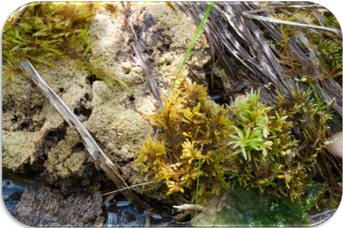
Avoti, kas izgulsnē avotkaļķus nelielu gabaliņu veidā.