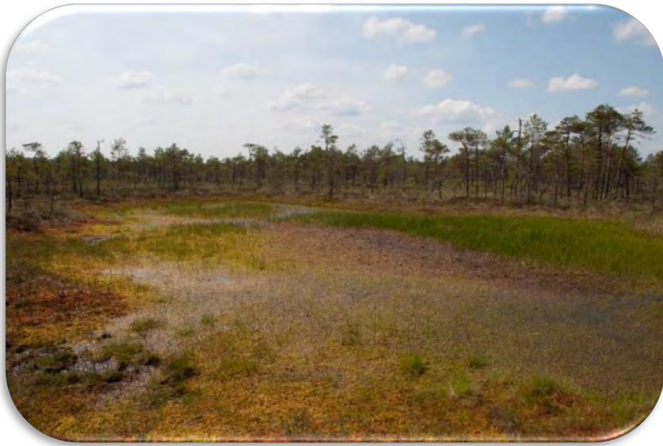
Grēdu-liekņu mikroreljefs, kur lieknā redzama slīkšņa.