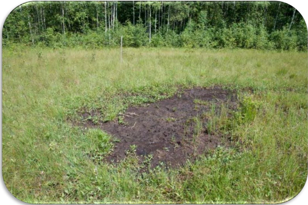
Atklāta kūdra kaļķainā zāļu purvā, kas veidojies avotu ietekmē.