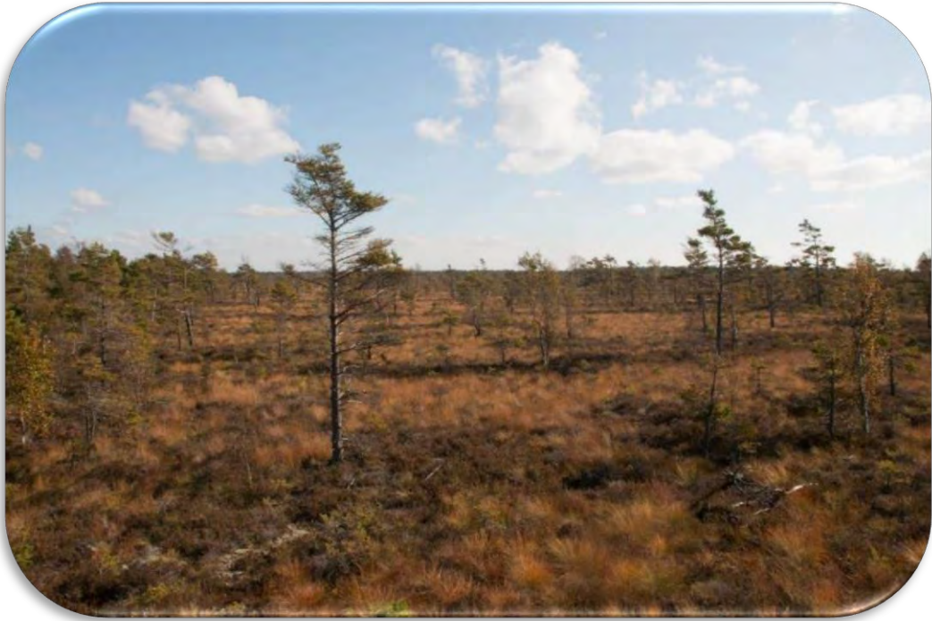
Ciņu mikroreljefs, ko veido ciņu mazmeldrs Trichophorum cespitosum , makstainā spilve Eriophorum vaginatum un sila virsis Calluna vulgaris . Sastopams galvenokārt Latvijas rietumu daļā.