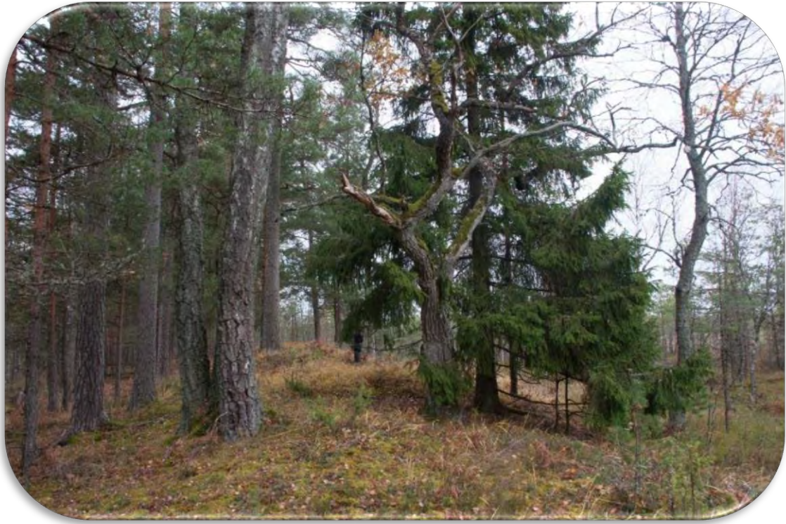
Minerālgrunts pacēlumi augstajā purvā. Uz tiem var būt gan Biotopu direktīvas I pielikuma meža biotopi, piemēram, 9010* Boreālie meži , gan mežaudzes, kas neatbilst I pielikuma meža biotopu nodalīšanas kritērijiem.