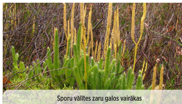
● Lycopodium clavatum VĀLĪŠU STAIPEKNIS