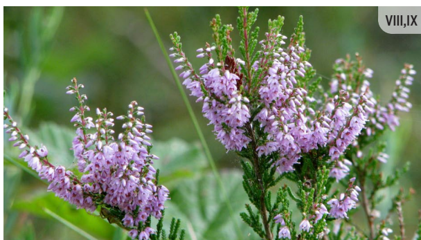
Calluna vulgaris SILA VIRSIS