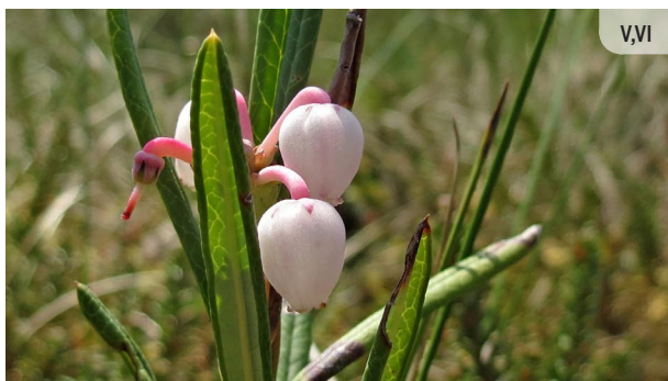
Andromeda polifolia POLIJLAPU ANDROMEDA