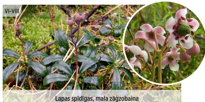
Lapas spīdīgas, mala zāgzobaina Chimaphila umbellata ČEMURU PALĒKS