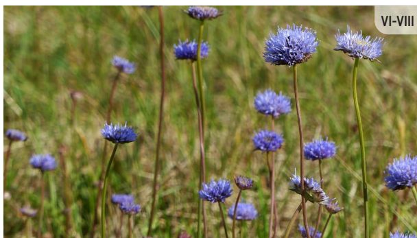
Jasione montana KALNU NORGALVĪTE