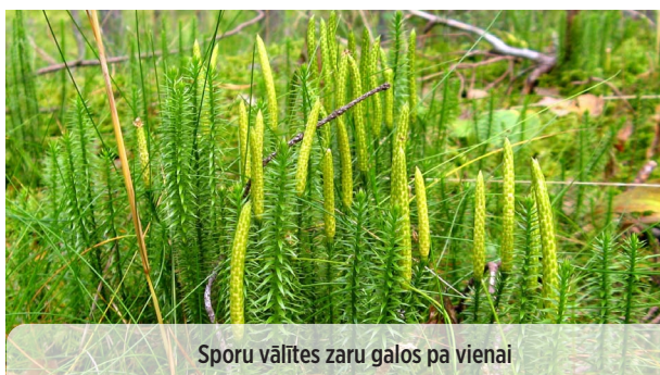
● Lycopodium annotinum GADA STAIPEKNIS