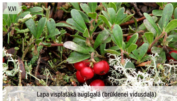
Arctostaphylos uva-ursi PARASTĀ MILTENE