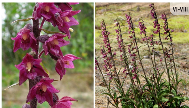
Epipactis atrorubens TUMŠSARKANĀ DZEGUZENE