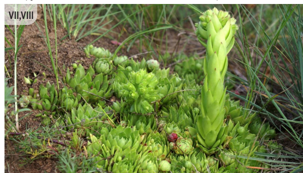
● Jovibarba globifera ATVAŠU SAULRIETENIS