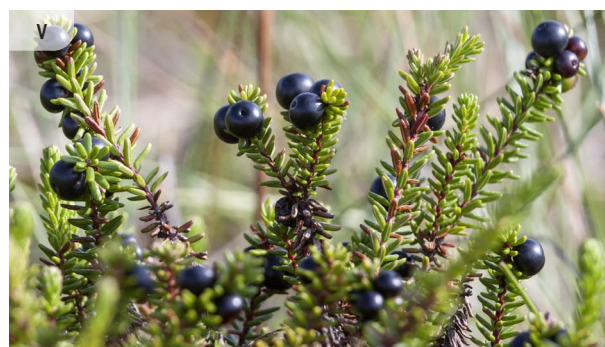
Empetrum nigrum MELNĀ VISTENE