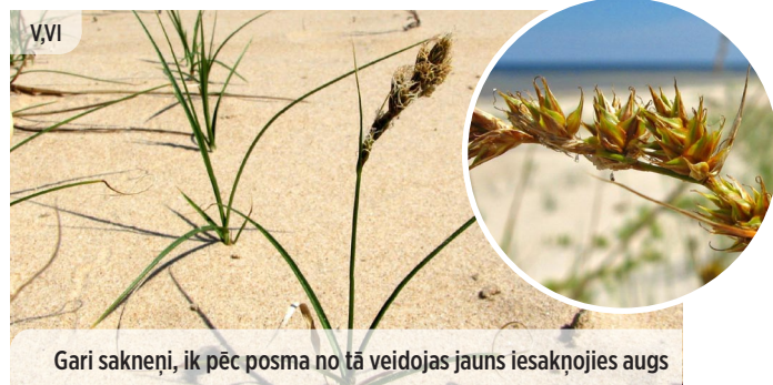
Gari sakneņi, ik pēc posma no tā veidojas jauns iesakņojies augs Carex arenaria SMILTĀJA GRĪSLIS