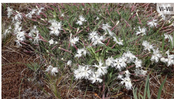
● Dianthus arenarius s.l. SMILTĀJA NEĻĶE