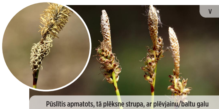
Pūslītis apmatots, tā plēksne strupa, ar plējainu/baltu galu Carex ericetorum VIRSĀJA GRĪSLIS