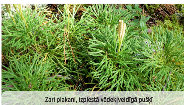
● Diphasium complanatum PARASTAIS PLAKANSTAIPEKNIS