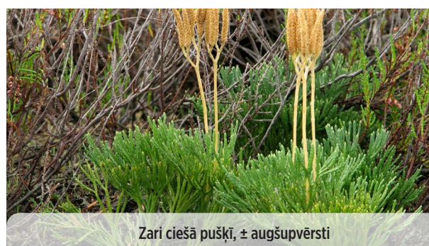
● Diphasium tristachyum TREJVĀRPU PLAKANSTAIPEKNIS