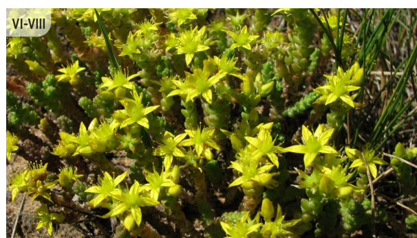
Sedum acre KODĪGAIS LAIMIŅŠ