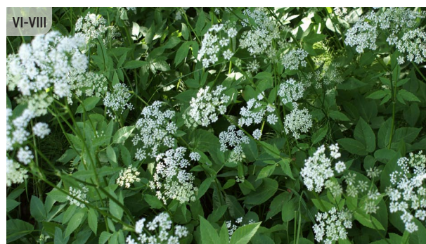
Aegopodium podagraria PODAGRAS GĀRSA