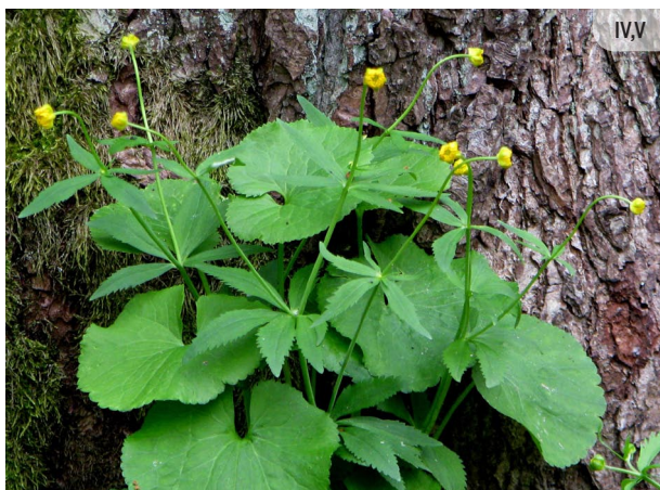
Ranunculus cassubicus KASŪBIJAS GUNDEGA