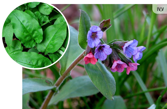
Pulmonaria obscura ĀRSTNIECĪBAS LAKACIS