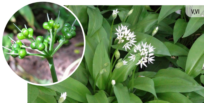
● Allium ursinum LAKSIS