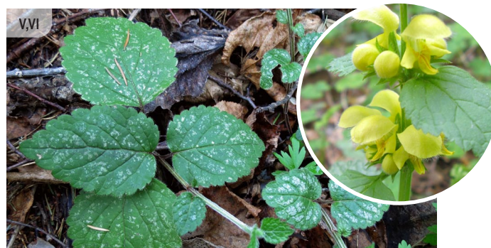
Galeobdolon luteum DZELTENĀ ZELTNĀTRĪTE