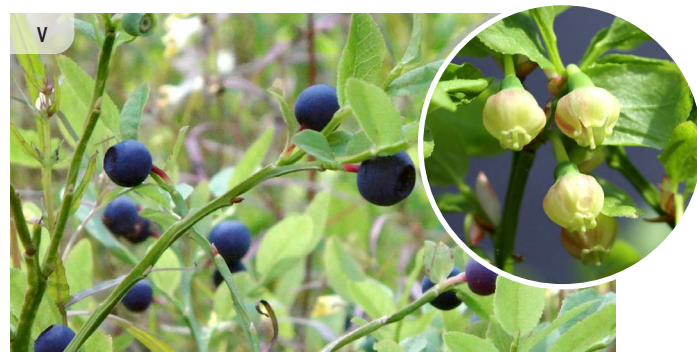
Vaccinium myrtillus MELLENE