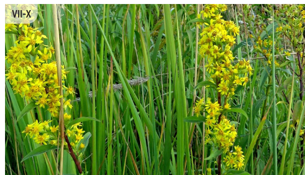
Solidago virgaurea DZELTENĀ ZELTGALVĪTE