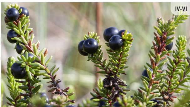
Empetrum nigrum MELNĀ VISTENE