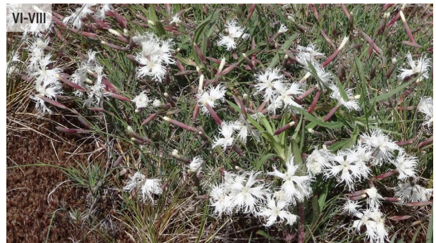
● Dianthus arenarius s.l. SMILTĀJA NEĻĶE