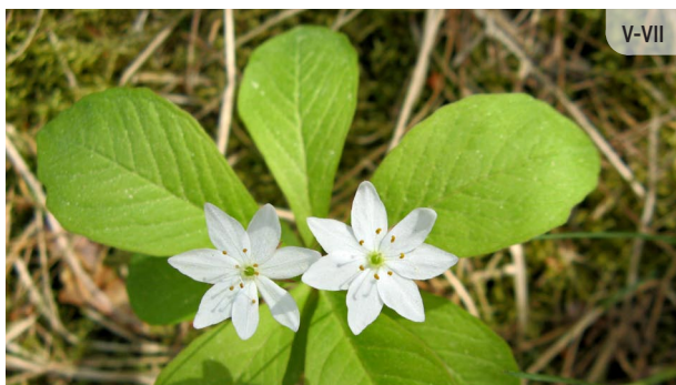
Trientalis europaea EIROPAS SEPTIŅSTARĪTE