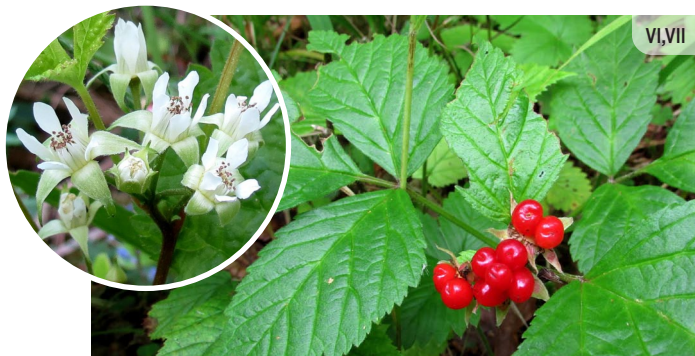
Rubus saxatilis KLINŠU KAULENE