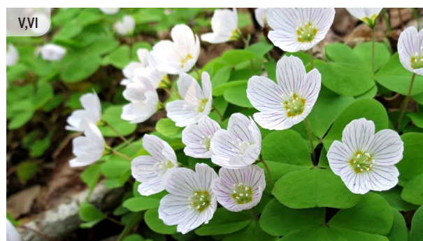
Oxalis acetosella MEŽA ZAKŠKĀBENE