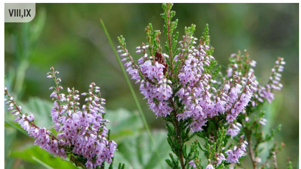
Calluna vulgaris SILA VIRSIS