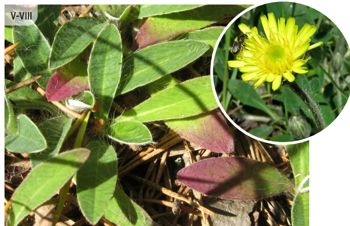
Hieracium pilosella MAZĀ MAURAGA (syn. Pilosella officinarum MATAINĀ PAMAURAGA)