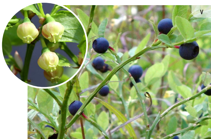
Vaccinium myrtillus MELLENE