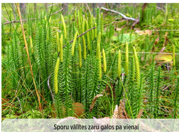
Sporu vāļītes zaru galos pa vienai

● Jovibarba globifera ATVAŠU SAULRIETENIS