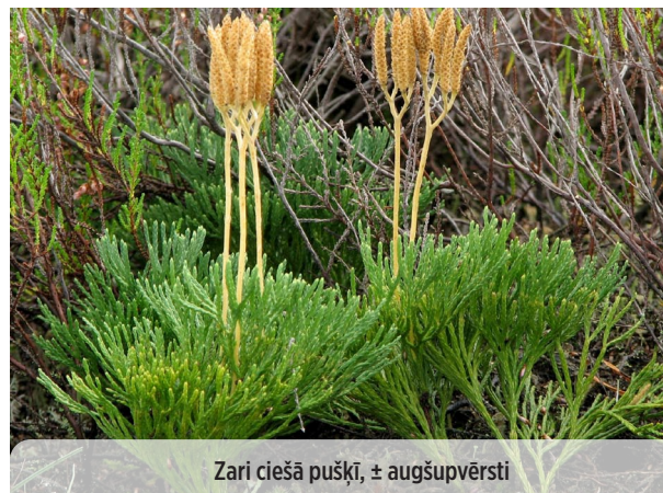
Zari ciešā pušķī, ± augšupvērsti

● Diphasium complanatum PARASTAIS PLAKANSTAIPEKNIS