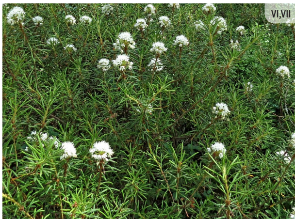
Ledum palustre PURVA VAIVARIŅŠ