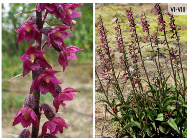
Epipactis atrorubens TUMŠSARKANĀ DZEGUZENE

● Diphasium tristachyum TREJVĀRPU PLAKANSTAIPEKNIS