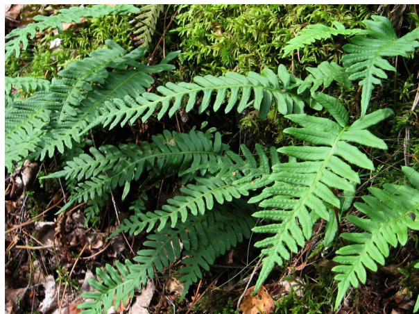
Polypodium vulgare PARSTĀ SALDSAKNĪTE