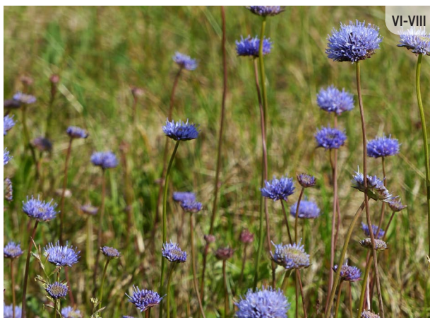
Jasione montana KALNU NORGALVĪTE