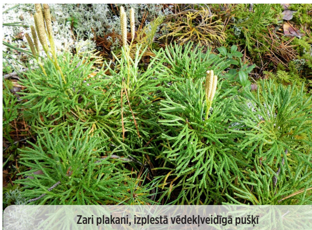
Zari plakani, izplestā vēdekļveidīgā pušķī

● Diphasium complanatum PARASTAIS PLAKANSTAIPEKNIS