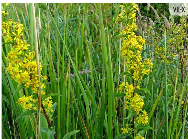
Solidago virgaurea DZELTENĀ ZELTGALVĪTE