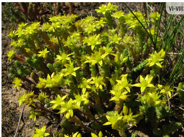
Sedum acre KODĪGAIS LAIMIŅŠ