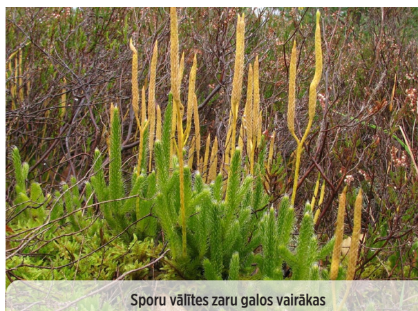
Sporu vāļītes zaru galos vairākas