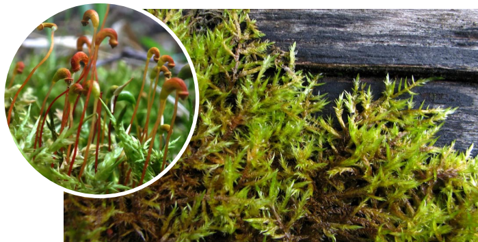
Calliergonella cuspidata PARASTĀ SMAILZARĪTE