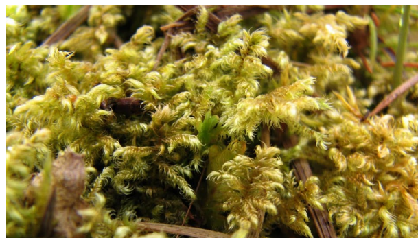
Ctenidium molluscum MĪKSTĀ ĶEMMZARE