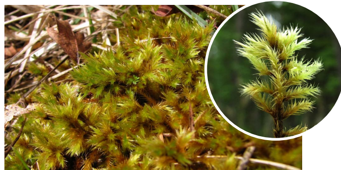
Tomenthypnum nitens SPĪDĪGĀ TŪBAINE