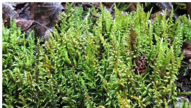
Cratoneuron filicinum PĀPARŽU DZĪSLENĪTE