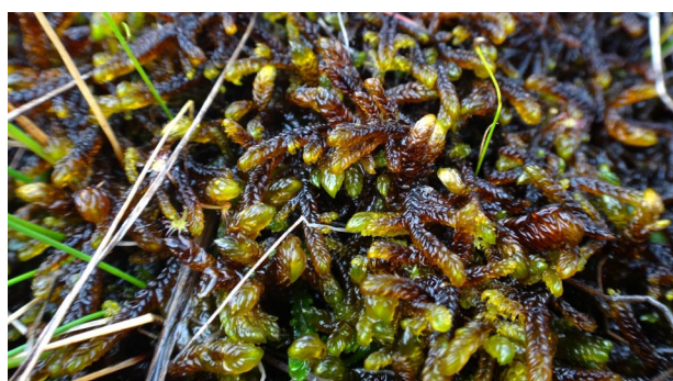
Scorpidium scorpioides PARASTĀ DIŽSIRPE