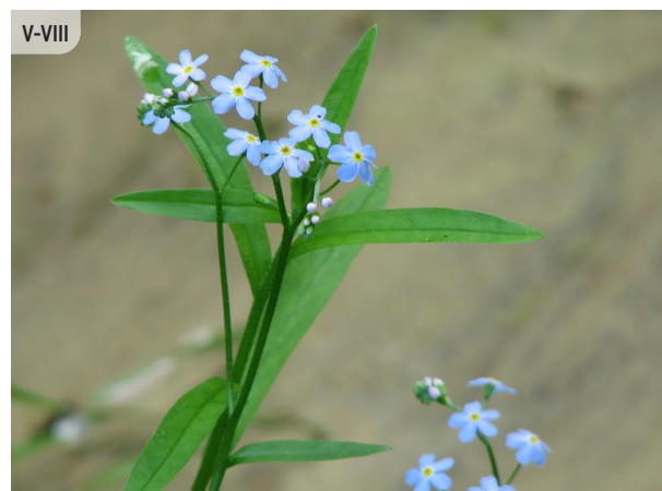
Myosotis palustris PURVA NEAIZMIRSTULĪTE