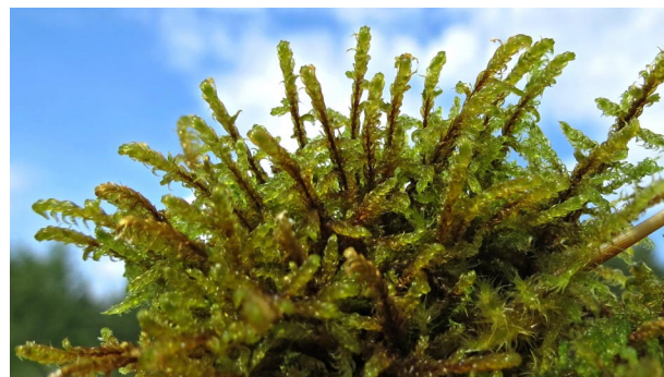
Scorpidium cossonii KOSONA DIŽSIRPE