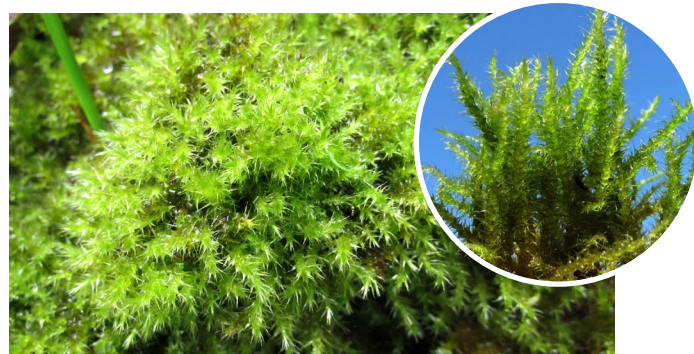
Campylium stellatum STARAINĀ ATSKABARDZE