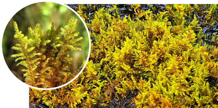
Palustriella commutata MAINĪGĀ AVOTSPALVE