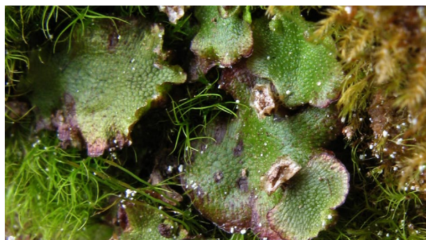
Preissia quadrata KVADRĀTISKĀ PREISIJA