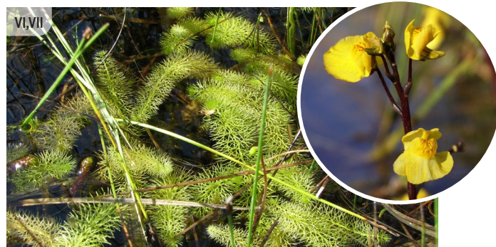
Utricularia spp. PŪSLENES