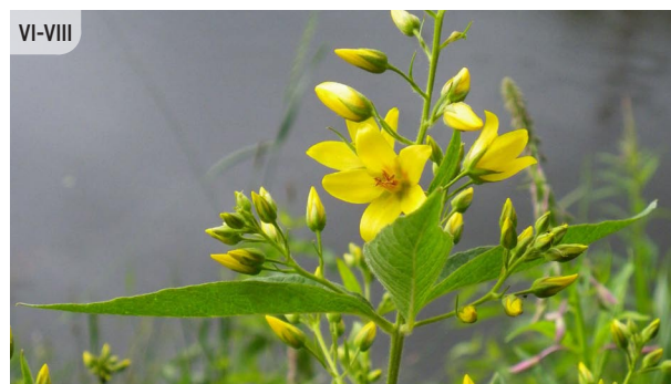
Lysimachia vulgaris PARASTĀ ZELTENE