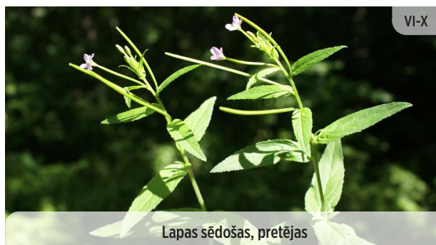
Epilobium palustre PURVA KAZROZE