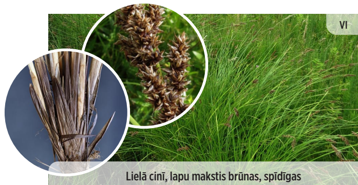
Lielā cini, lapu makstis brūnas, spīdīgas Carex paniculata SKARAINAIS GRĪSLIS