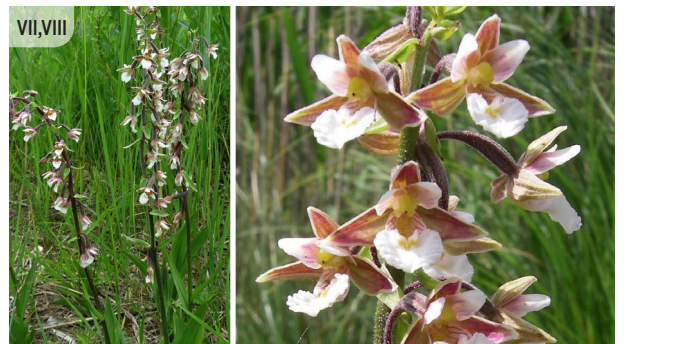
Epipactis palustris PURVA DZEGUZENE