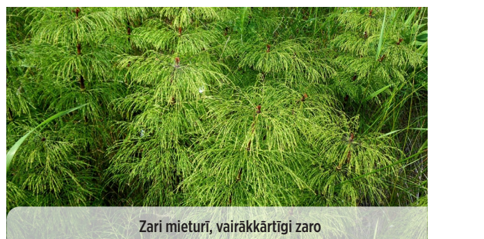
Equisetum sylvaticum MEŽA KOSA