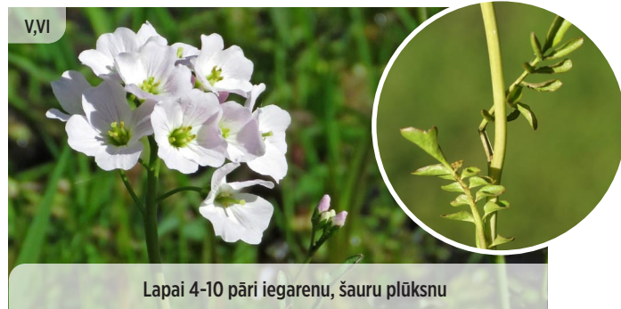
Lapai 4-10 pāri iegarenu, šauru plūksnu Cardamine pratensis PĻAVAS ĶĒRSA