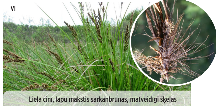
Lielā cini, lapu makstis sarkanbrūnas, matveidīgi šķeļas Carex appropinquata SATUVINĀTAIS GRĪSLIS