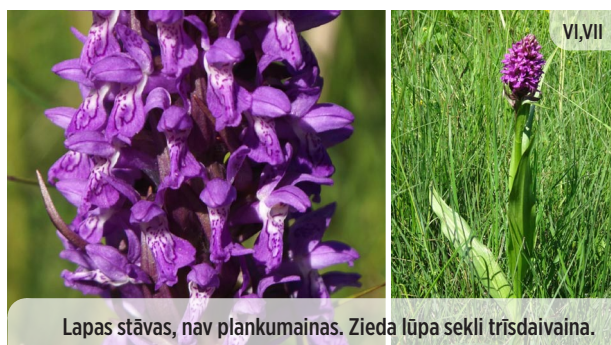
● Dactylorhiza incarnata STĀVLAPU DZEGUŽPIRKSTĪTE