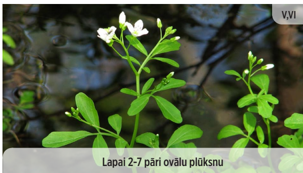
Lapai 2-7 pāri ovālu plūksnu Cardamine amara RŪGTĀ ĶĒRSA