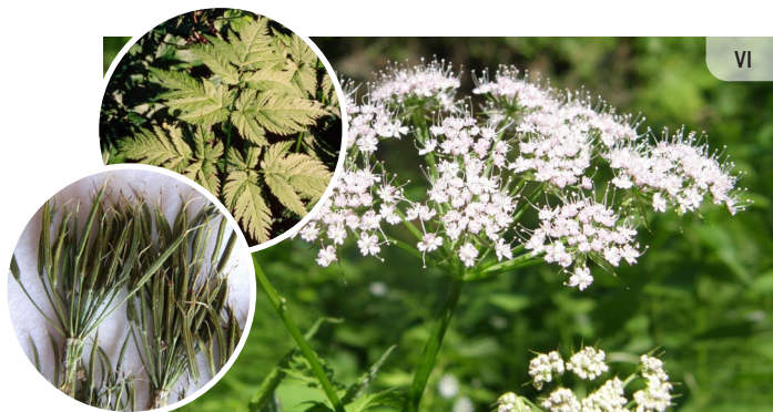
● Chaerophyllum hirsutum SKARBMATAINĀ KĀRVELE