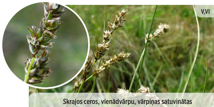
Skrajos ceros, vienādvārpu, vārpiņas satuvinātas Carex diandra DIVPUTEKŠŅLAPU GRĪSLIS