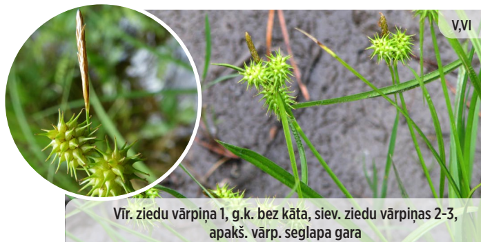
Vir. ziedu vārpiņa 1, g.k. bez kāta, siev. ziedu vārpiņas 2-3, apakš. vārp. seglapa gara Carex flava DZELTENAIS GRĪSLIS