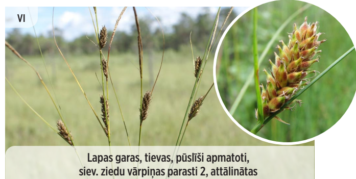
Lapas garas, tievas, pūslīši apmatoti, siev. ziedu vārpiņas parasti 2, attālinātas Carex lasiocarpa PŪKAUGĻU GRĪSLIS