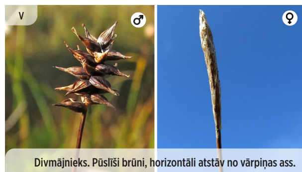
Divmājnieks. Pūslīši brūni, horizontāli atstāv no vārpiņas ass. Carex dioica DIVMĀJU GRĪSLIS