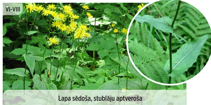
● Crepis paludosa PURVA CIETPIENE