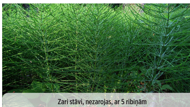
Equisetum palustre PURVA KOSA