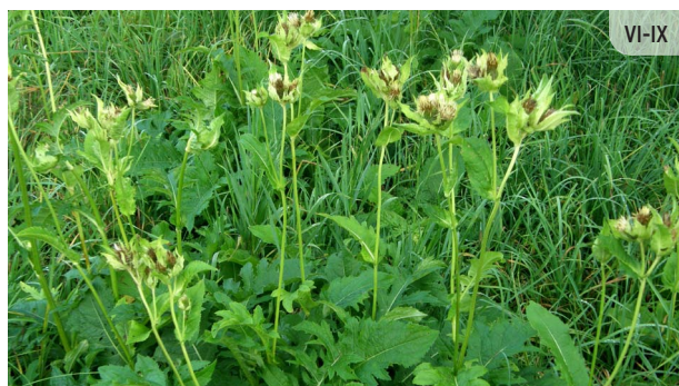
Cirsium oleraceum LĒDZERKSTE