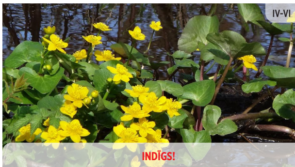
INDĪGS! Caltha palustris PURVA PURENE