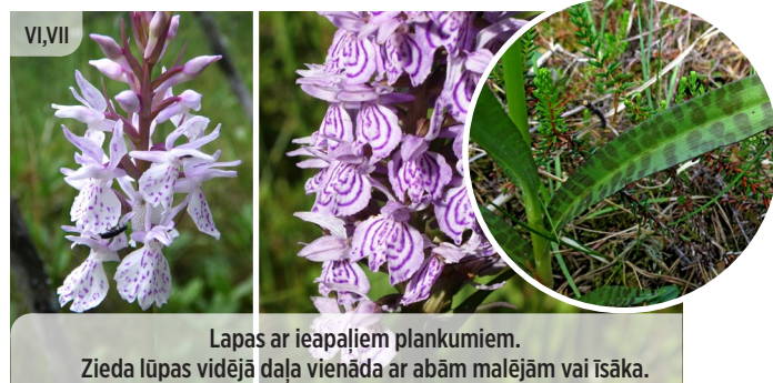
● Dactylorhiza maculata PLANKUMAINĀ DZEGUŽPIRKSTĪTE