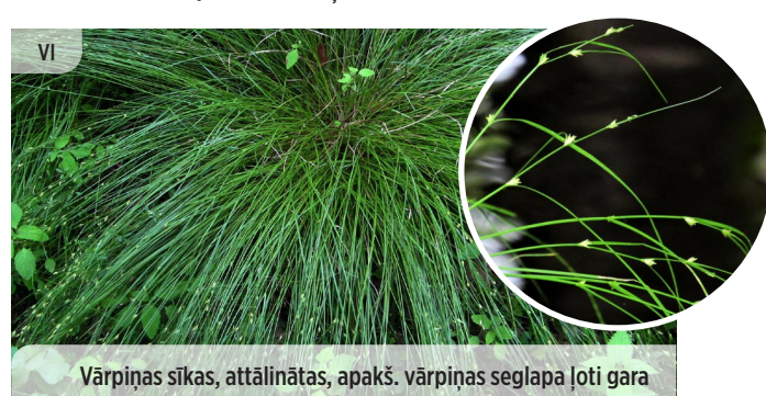
Vārpiņas sīkas, attālinātas, apakš. vārpiņas seglapa ļoti gara Carex remota ATTĀLVĀRPU GRĪSLIS