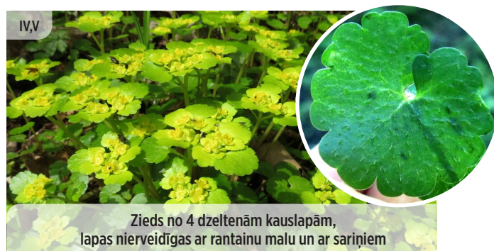
● Chrysosplenium alternifolium PAMĪSLAPU PAKRĒSLĪTE