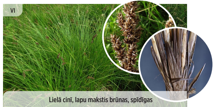
Lielā cini, lapu makstis brūnas, spīdīgas Carex paniculata SKARAINAIS GRĪSLIS