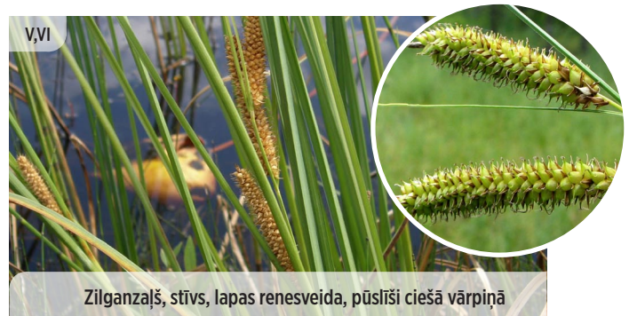
Zilganzaļš, stīvs, lapas renesveida, pūslīši ciešā vārpiņā Carex rostrata UZPŪSTAIS GRĪSLIS