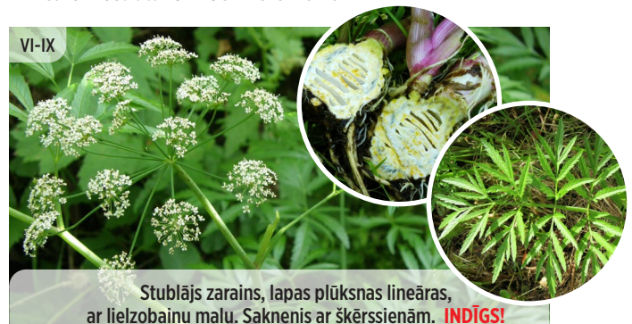
Stublājs zarains, lapas plūksnas lineāras, ar lielzobainu malu. Sakneņi ar šķērssienu. INDĪGS! Cicuta virosa INDĪGAIS VELNARUTKS