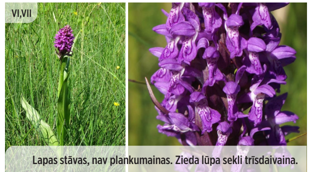
Lapas stāvas, nav plankumainas. Zieda lūpa seklī trīsdaivaina. ● Dactylorhiza incarnata STĀVLAPU DZEGUŽPIRKSTĪTE