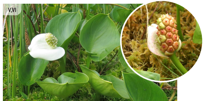
Calla palustris PURVA CŪKAUSIS