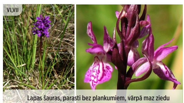
Lapas šauras, parasti bez plankumiem, vārpā maz ziedu ● Dactylorhiza russowii RUSOVA DZEGUŽPIRKSTĪTE