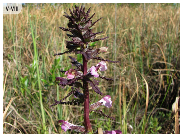
Pedicularis palustris PURVA JĀŅEGLĪTE