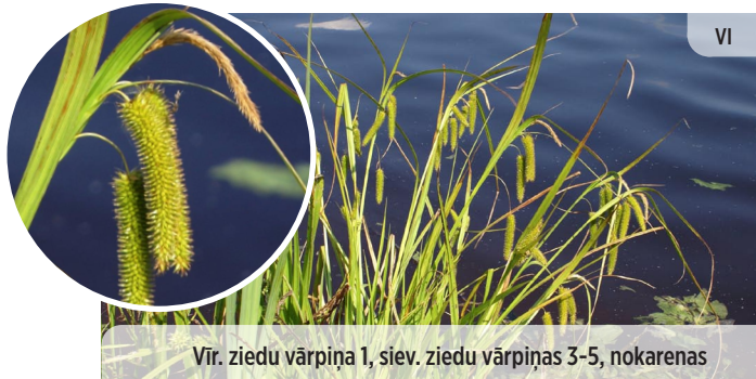
Vir. ziedu vārpiņa 1, siev. ziedu vārpiņas 3-5, nokarenas Carex pseudocyperus DIŽMELDRU GRĪSLIS