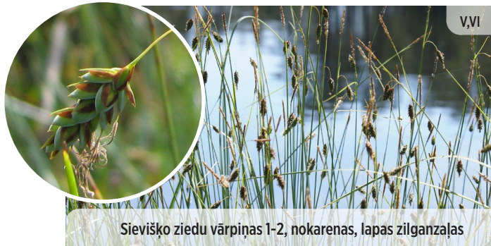
Sievišķo ziedu vārpiņas 1-2, nokarenas, lapas zilganzaļas Carex limosa DŪKSTU GRĪSLIS