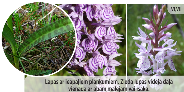
Lapas ar ieapaļiem plankumiem. Zieda lūpas vidējā daļa vienāda ar abām malējām vai īsāka. ● Dactylorhiza maculata PLANKUMAINĀ DZEGUŽPIRKSTĪTE