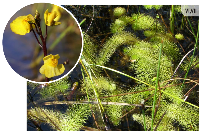
Utricularia spp. PŪSLENES