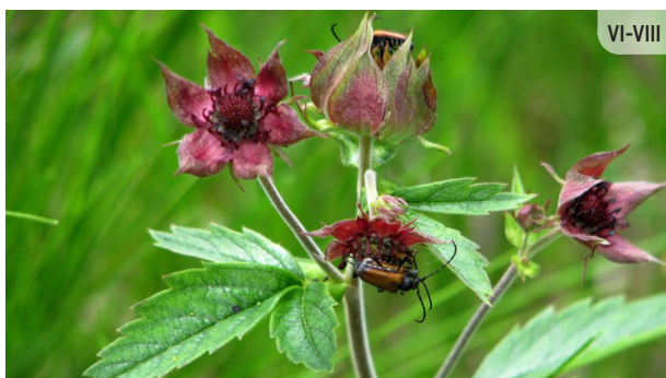
Comarum palustre PURVA VĀRNKĀJA