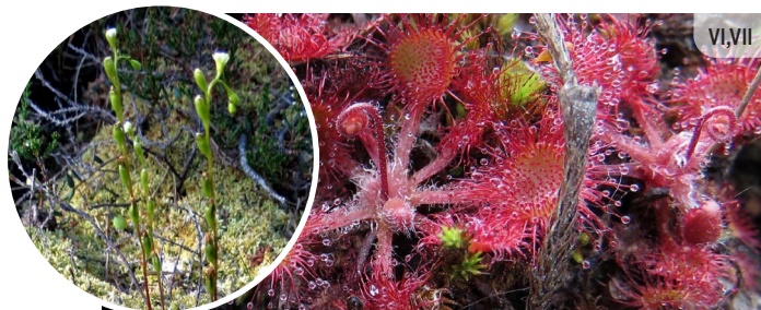
Drosera anglica GARLAPU RASENE

Lapas iegarenas, ziednesis garš, augs līdz 20 cm augsts