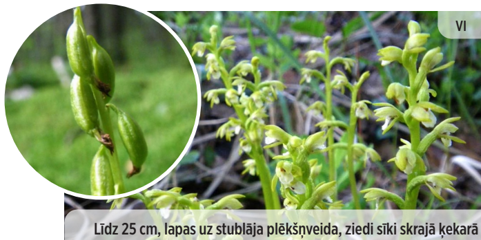
Līdz 25 cm, lapas uz stublāja plēkšņveida, ziedi sīki skrajā ķekarā ● Coralorhiza trifida TREJDAIVU KORALĶŠAKNE