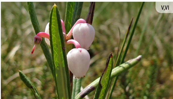
Andromeda polifolia POLIJLAPU ANDROMEDA