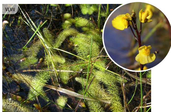
Utricularia spp. PŪSLENES