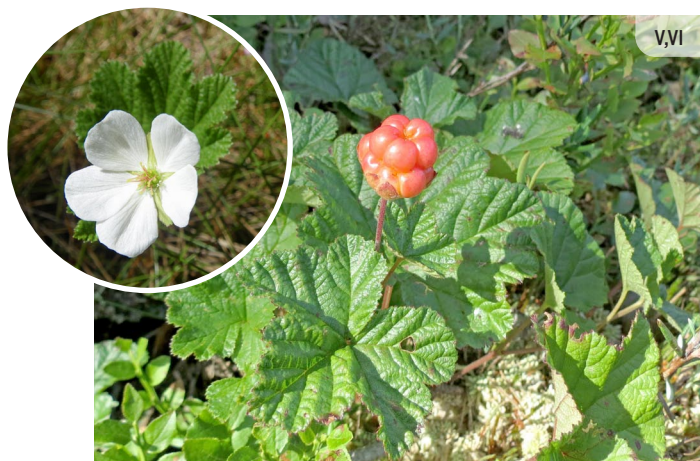
Rubus chamaemorus LĀCENE