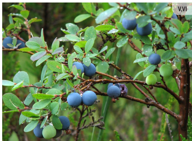
Vaccinium uliginosum ZILENE