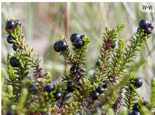
Empetrum nigrum MELNĀ VISTENE