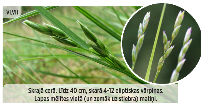
Phleum phleoides STEPES TIMOTIŅŠ

Skrajā cerā. Līdz 40 cm, skarā 4-12 eliptiskas vārpiņas. Lapas mēlītes vietā (un zemāk uz stiebra) matiņi.