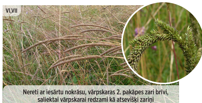
Koeleria glauca ZILGANĀ KELĒRIJA

Nereti ar iesārtu nokrāsu, vārpskaras 2. pakāpes zari brīvi, saliektai vārpskarai redzami kā atsevišķi zariņi