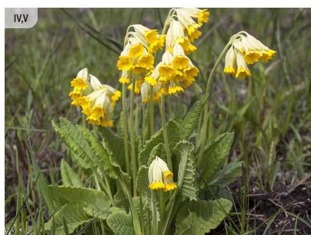
Primula veris GAIĻBIKSĪTE