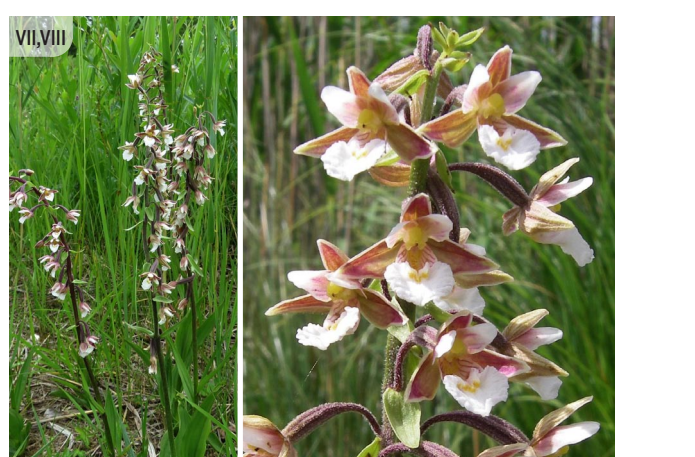
Epipactis palustris PURVA DZEGUZENE