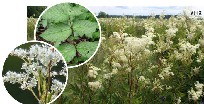
Filipendula ulmaria PARASTĀ VĪGRIEZE