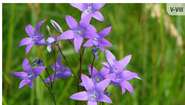
Campanula patula PĻAVAS PULKSTENĪTE