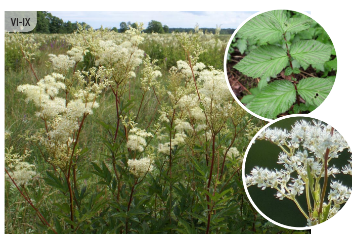
Filipendula ulmaria PARASTĀ VĪGRIEZE