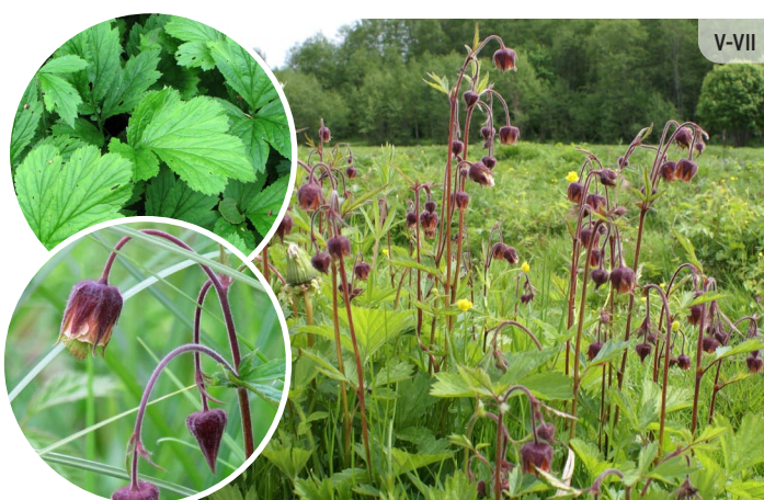
Geum rivale PĻAVAS BITENE