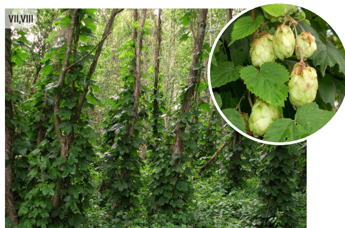
Humulus lupulus PARASTAIS APINIS