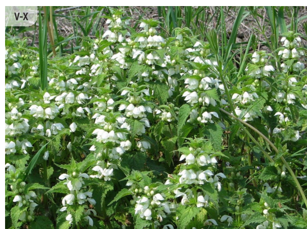
Lamium album BALTĀ PANĀTRE