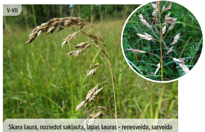
Koeleria glauca ZILGANĀ KELĒRIJA

Skara šaura, noziedot sakļauta, lapas šauras - renesveida, sarveida