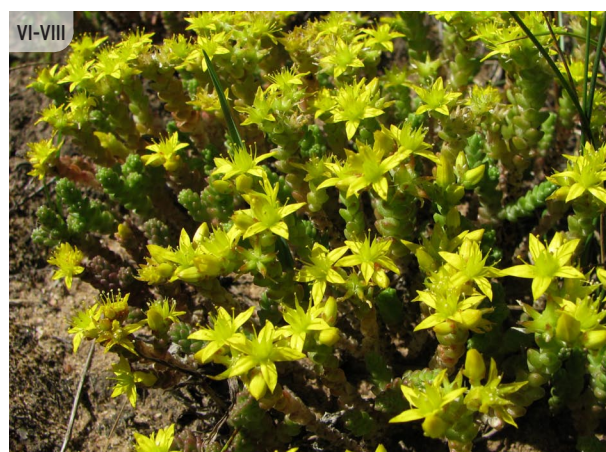
Sedum acre KODĪGAIS LAIMIŅŠ