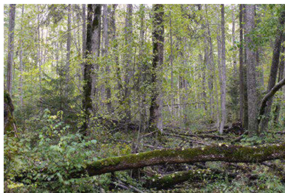
2. att. Biotopam raksturīgs dažādu platlapju koku sugu mistrojums ar atsevišķām boreālo mežu pazīmēm pamežā (egles) un zemsedzē, kas iezīmē biotopa platlapju boreālu mežu pārejas tipa būtību. Biotops 9020 Veci jaukti platlapju meži dabas liegumā „Paltupes meži”