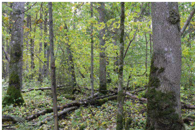
3. att. Biotopam raksturīga augsta dabiskuma pakāpe – kokaudzes dabisko struktūru veido dažāda izmēra, vecuma un sugu koki, ievērojams daudzums dabiskiem mežiem specifiskas epifītu sugas: parastais plaušķērpis Lobaria pulmonaria , tievā gludlape Homalia trichomanoides un īssetas nekeras Neckera pennata . Dabas liegumā „Paltupes meži”

Procesi ar funkcionālu nozīmi: biotopam saistošie traucējumi ir meži ar pašizrobošanās dinamiku un dažos gadījumos arī zālēdāju ietekme, ja senāk bijušas meža ganības. Nav raksturīgi plašas pārmaiņas izraisīti dabiskie traucējumi. Sastopams teritorijās, kurās pēdējos 70–100 gadus nav notikušas kailcirtes. Būtiskākais process ir atvērums dinamika jeb audzes pašizrobošanās, kad lielu koku vai dažus kokus izgāž vējš, vai arī tas iet bojā citu iemeslu dēļ, un kokaudzes vainagā veidojas atvērums (Angelstam, 2004). Dabisko procesu rezultātā audze atrodas kompleksās attīstības stadijā, dabiskās mirstības rezultātā veidojas neregulāri atvērumi audzes klājā, tajos parasti atjaunojas pioniersugas, pastiprināti veidojas platlapju paauga, vai strauji attīstās jau esošā paauga (Johanson, 2002).