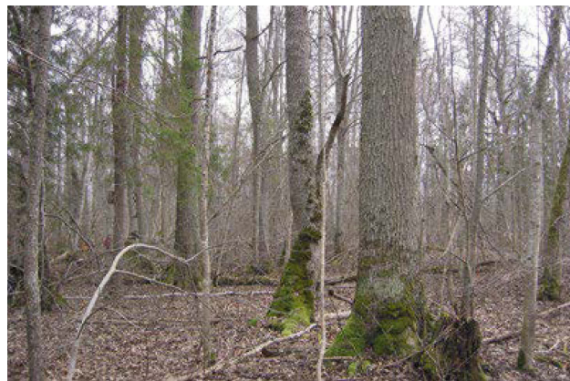
4. att. Biotopa fragments ar ozoliem dabas liegumā „Audīles meži”. Šajā gadījumā kokaudzē ozolu īpatsvars dabā ir mazāks par 50%, ja to būtu vairāk – biotops būtu pieskaitāms 9160 Ozolu meži

Veģētācijas raksturojums: biotops pieder Eiropas platlapju klases mežiem, tādēļ tā zemsedzes veģētācijai raksturīgs pavasara aspekts. Raksturīgs audzes stāvokums – bez pirmā un otrā stāva parasti ir labi attīstījusies platlapju paauga un pamežs. Dabisko traucējumu rezultātā var būt mozaikveida veģētācija un audzes struktūra, koku izvietojums nevienmērīgs, sastopamas neregulāras formas jaunāku koku grupas, var dominēt arī samērā jauni koki, zema biezība, grupveida paauga. Ņemot vērā to, ka biotops atrodas boreālās un nemorālās mežu joslas pārejas zonā, tad iespējamās sabiedrības ar boreālo mežu sugām, piemēram, parasto egli Picea abies , Eiropas septiņstarīti Trientalis europaea , divlapu žagatiņu Maianthemum bifolium .