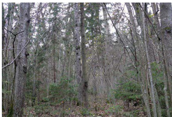
5. att. Biotopa pirmajā stāvā dominē apse Populus tremula , pamežā un zemsedzē ir biotopu raksturojošās platlapju mežu sugas sajaukumā ar citam ES nozīmes biotopam – 9010* Veci vai dabiski boreāli meži – raksturīgajām boreālo mežu sugām. Šajā gadījumā jāizšķiras, kura biotopa pazīmes ir vairākumā

izciršanu un kontrolētu dedzināšanu. Biežākais nepieciešamais apsaimniekošanas veids ir neiejaukšanās, pārējie veidi tikai retos gadījumos (Ikauniece, 2016)