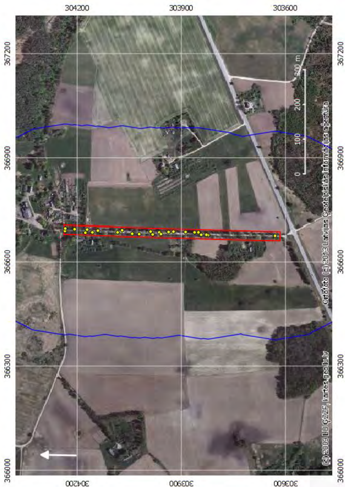
1.attēls. Vecvilgāles alejas ģeogrāfiskā novietojuma kartoshēma (LKS-92 koordinātu sistēma, ziemeļu virziens norādīts ar bultu attēla apakšējā kreisajā stūrī). Paskaidrojumi: alejas robežas parādītas ar sarkanu krāsu, uzkartētie dobumainie koki parādīti ar dzelteniem aplīšiem, ar zilu līniju parādīta 300m buferjosla ap uzkartētajiem dobumainajiem kokiem, saskaņā ar literatūras datiem –parasti šādā attālumā spēj pārvietoties lapkoku praulgrauži, ar sarkaniem aplīšiem parādīta aizsargājamo bezmugurkaulnieku sugu atradnes. Alejas robežu dati: Dabas aizsardzības datu pārvaldības sistēma "Ozols" (skatīts 30.10.2016.). Pamatnes dati: 5.etapa ortofoto karte (Latvijas Ģeotelpiskās informācijas aģentūra, 2013), LU ĢZZF WMS, skatīts 30.10.2016., pieejams http://www.kartes.geo.lu.lv . Kartoshēma sagatavota QGIS 2.12.3.