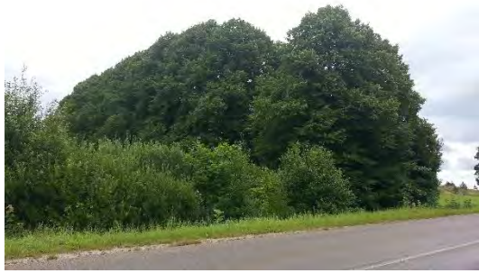
6.attēls. Liepu alejas turpinājums otrpus šosejai, sānskats. Foto: Evita Oļehnoviča,2016.