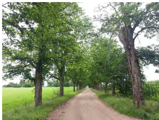
2.attēls. Vecmoku kļavu aleja,pretskats no Vecmoku parka puses.