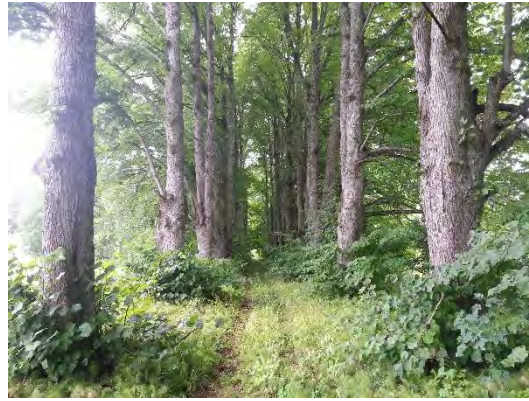
7.attēls. Liepu alejas turpinājums otrpus šosejai, pretskats. Foto: Evita Oļehnoviča,2016.

Trešā Vecmoku aleja izvietota gar zemes ceļu, kas ved no Vecmoku parka līdz Ķīļu kapiem aptuveni 1,1 km garumā, šī ir garākā no Vecmoku alejām, kā arī garākā Holandes liepu aleja Latvijā. Aleju pamatā veido vidēju dimensiju liepas, kas stādītas vienā rindā katrā ceļa pusē (8.attēls). Alejai piegulošo teritoriju veido lauksaimniecības zemes ar atsevišķām lauku viensētām, pie vienas no blakus alejai esošajām viensētām alejas koku rindās nelieli pārrāvumi. Aleja ved pa paugurainu reljefu un kopumā ir ļoti ainaviska (9. attēls).