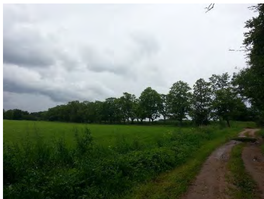
1.attēls. Vecmoku kļavu aleja, sānskats no Vecmoku parka puses.

Vecmoku aleju shēma un robežu apraksts dots 22.11.2005. MK noteikumu Nr.888 “Noteikumi par aizsargājamām alejām” 42. pielikumā. Vecmoku alejas veido trīs alejas. Pirmā aleja ievēd Vecmokās, braucot no Tukuma puses, tā izvietota gar zemes ceļu aptuveni 300 m garā posmā starp Tukuma – Ventpils veco ceļu un Vecmoku parku. Aleju pamatā veido vidēju dimensiju kļavas, kuras stādītas vienā rindā katrā ceļa pusē (1. – 2. attēls). Alejai piegulošo teritoriju veido lauksaimniecības zemes.