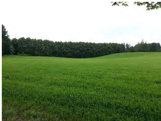
3.attēls. Vecmoku liepu aleja virzienā no Ventspils – Tukuma ceļa puses, sānskats.

Otrā Vecmoku aleja ieved Vecmokās no Ventspils puses, tā izvietota gar gājēju taku aptuveni 190 m garā posmā starp Tukuma - Ventspils veco ceļu un Vecmoku parku. Aleju veido vidēju dimensiju liepas, kas blīvi stādītas vienā rindā katrā takas pusē (3. – 4. attēls). Alejai piegulošo teritoriju veido lauksaimniecības zemes.