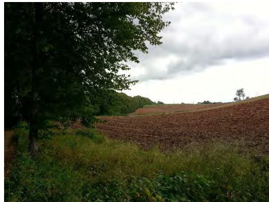
9. attēls. 8.attēls. Vecmoku liepu aleja virzienā uz Ķīļu kapiem, sānskats netālu no Ķīļu kapiem.