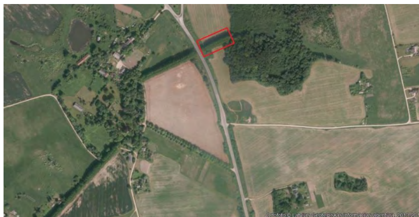
5. attēls. Liepu alejas turpinājums otrpus šosejai (iezīmēts ar sarkanu līniju). Kartes mērogs 1:5000, Kartes pamatne: Latvijas Ģeotelpiskās informācijas aģentūra 2013 – 2015.

Aleja turpinās otrpus Tukuma - Ventspils vecajam ceļam aptuveni 90 m garā posmā (5.attēls). Šis alejas posms nav iekļauts Vecmoku aizsargājamo aleju robežās, lai gan ainaviski un vēsturiski veido vienu aleju ar aizsargāto liepu alejas daļu (6. – 7.attēls). Posma sākuma koordinātas: x 444380, y 317816; beigu koordinātas x 444463, y 317857 (koordinātas noteiktas kamerāli).