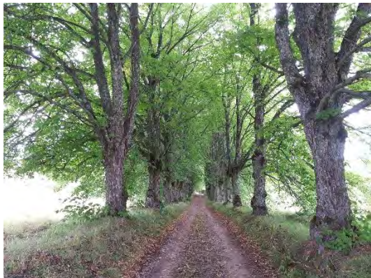
8.attēls. Vecmoku liepu aleja virzienā uz Ķīļu kapiem, pretskats alejas vidusdaļā.

Trešā Vecmoku aleja izvietota gar zemes ceļu, kas ved no Vecmoku parka līdz Ķīļu kapiem aptuveni 1,1 km garumā, šī ir garākā no Vecmoku alejām, kā arī garākā Holandes liepu aleja Latvijā. Aleju pamatā veido vidēju dimensiju liepas, kas stādītas vienā rindā katrā ceļa pusē (8.attēls). Alejai piegulošo teritoriju veido lauksaimniecības zemes ar atsevišķām lauku viensētām, pie vienas no blakus alejai esošajām viensētām alejas koku rindās nelieli pārrāvumi. Aleja ved pa paugurainu reljefu un kopumā ir ļoti ainaviska (9. attēls).