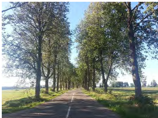
1.attēls. Trapenes alejas liepu stādījumi. Foto: Evita Oļehnoviča, 2016.

Trapenes alejas shēma un robežu apraksts dots 22.11.2005. MK noteikumu Nr.888 “Noteikumi par aizsargājamām alejām” 2. pielikumā. Trapenes aleja izvietota gar Trapenes – Līzespasta ceļu posmā no pagrieziena uz mājām “Lipši” līdz bijušajai Trapenes muižai. Aleju aptuveni 850 m garumā veido vidēju dimensiju liepu stādījumi, kas pāriet vidēju līdz lielu dimensiju lapegļu stādījumos. Alejai piegulošo teritoriju tās lielākajā daļā veido lauksaimniecības zemes ar izklaidus izvietotām lauku viensētām, tuvojoties Trapenes ciemam aleja ved cauri mazdārziņu teritorijai, alejas beigu daļā Trapenes ciema centrā tai piegulošo teritoriju veido ciema apbūve.