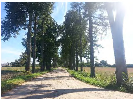
1.attēls. Podzēnu aleja, skats Siguldas –

Podzēnu alejas shēma un robežu apraksts dots 22.11.2005. MK noteikumu Nr.888 “Noteikumi par aizsargājamām alejām” 48. pielikumā. Aleja izvietota gar Podzēnu iebraucamo zemes ceļu aptuveni 670 m garā posmā (1. - 2. attēls). Aleju veido vidēju līdz lielu dimensiju lapegles, starp kurām stādīti dažādu sugu platlapju koki (liepas, kļavas, oši). Alejas koki stādīti vienā rindā katrā ceļa pusē. Alejai piegulošo teritoriju veido lauksaimniecības zemes ar atsevišķām lauku viensētām.