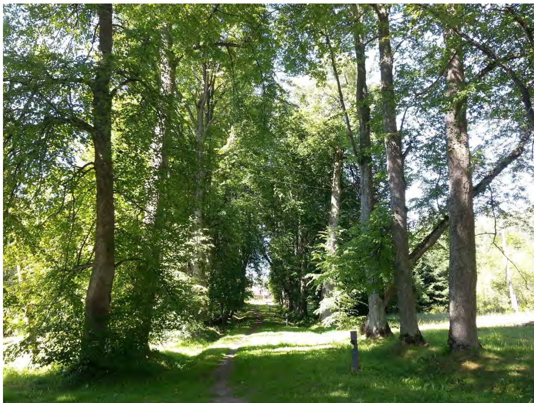
1.attēls. Pēterupes Līgotņu mācītājmājas aleja. Foto: Evita Oļehnoviča, 2016.