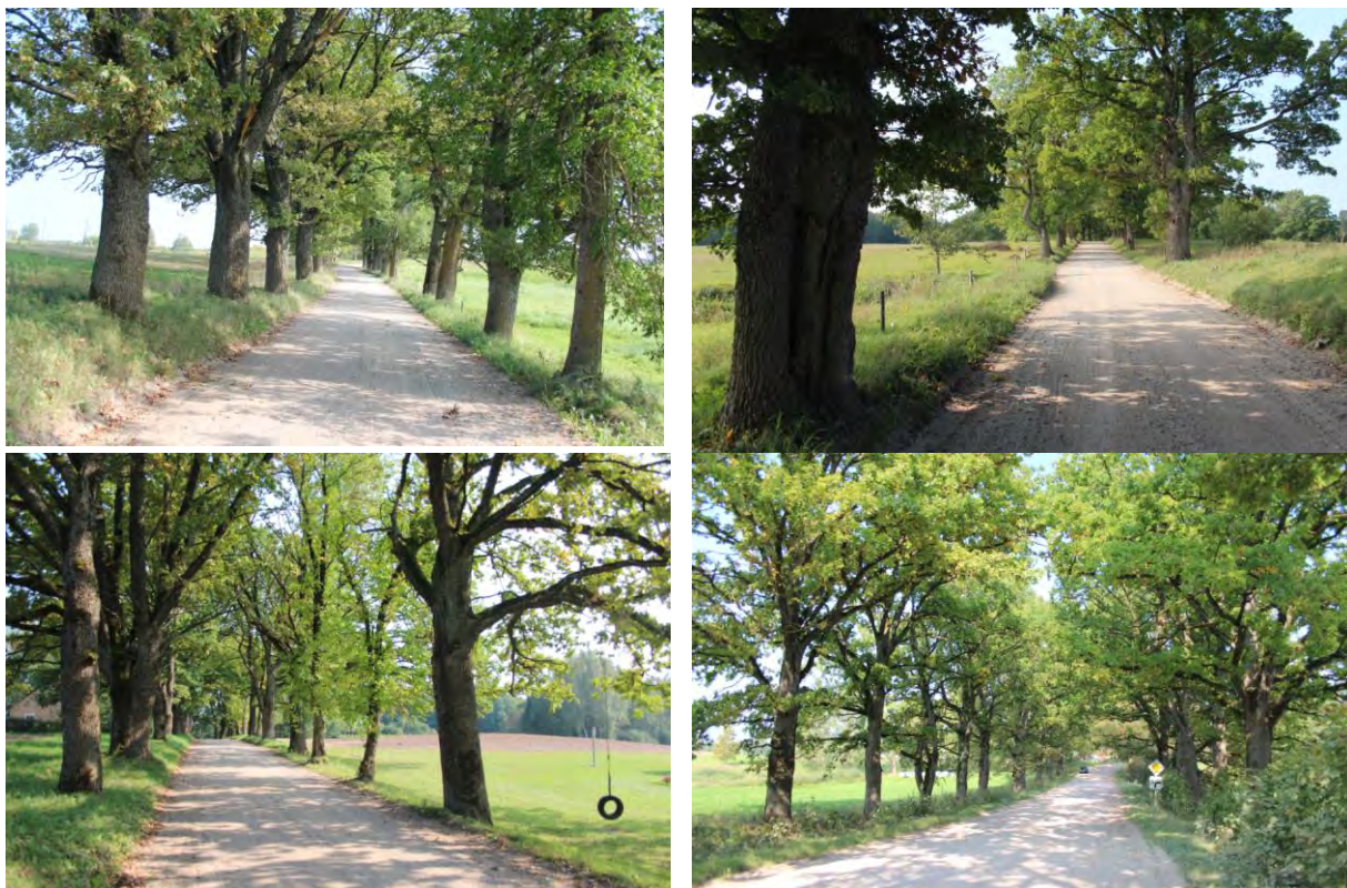
3.attēls. Vispārīgs Lielaucē alejas raksturojums.

Vispārīgs vizuāls priekšstats par Aleju iegūstams, iepazīstoties ar 3.attēlu. Gar lauku grantētu ceļu novietota, ainaviska, bioloģiski vecu ozolu (piemistrojumā, oši un liepas) aleja. Koki aug 0,5-1m attālumā no ceļa braucamās daļas. Uz ceļa novērota vidējas intensitātes transportlīdzekļu kustība. Alejai ir tipiska tuneļveida struktūra, koku vainagi saskaras. Ozoliem resni apakšējie zari, redzams, ka koki auguši atklātos apstākļos. Vietām, īpaši Alejas austrumu daļā, lielāki pārrāvumi, iztrūkstoši koki. Alejai visumā vienvecuma struktūra. Aleja novietota uz nedaudz nelīdzena reljefa. Pieguļošajā teritorijā lauksaimniecības zemes – ganības, zālāji, aramzemes, kā arī dzīvojamā apbūve. Netālu Lielaucē teritorijā ir pieejami vēl papildus dobumaini veci platlapji.