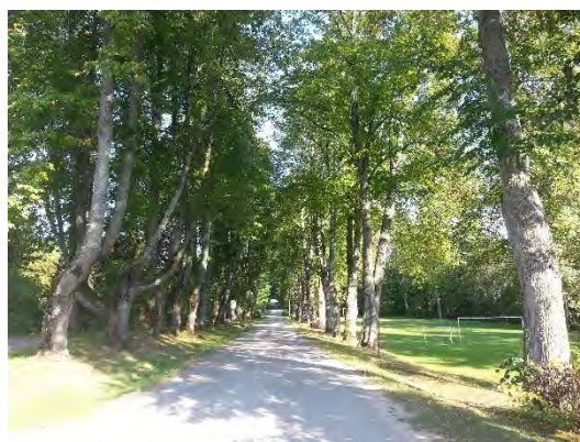
2.attēls. Jersikas aleja tās beigu daļā pie Jersikas skolas. Foto: Evita Oļehnoviča, 2016.

Alejai piegulošos teritoriju tās sākuma daļā veido neliela zālāja un meža josla, zālāja teritorijā invazīvas sugas – Sosnovska latvāņa puduri. Alejas posmā pēc elektrolīnijas pārrāvuma tai piegulošo teritoriju veido Jersikas pamatskola un stadions, kā arī dzīvojamās mājas.