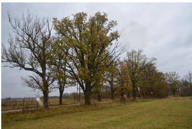
Alejas posms ārpus ĪADT