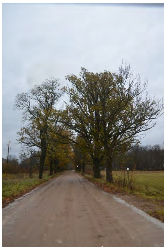
Alejas posms ārpus ĪADT