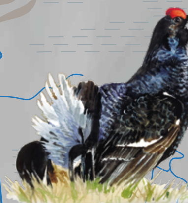
Rubenis Lyrurus tetrix