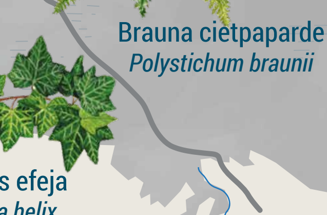
Brauna ciētpaparde Polystichum braunii