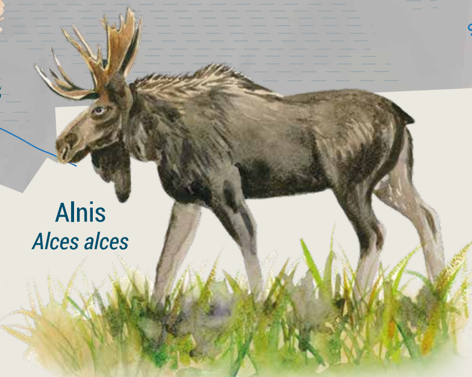
Alnis Alces alces