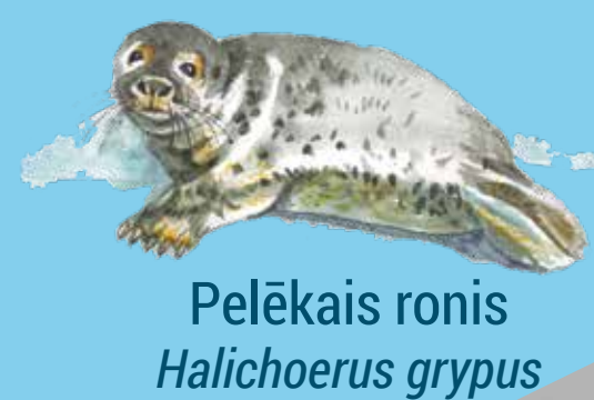
Pelēkais ronis Halichoerus grypus