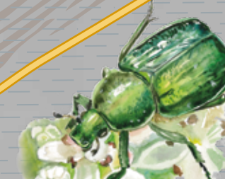
Spīdīgais praulgrauzis Gnorimus nobilis