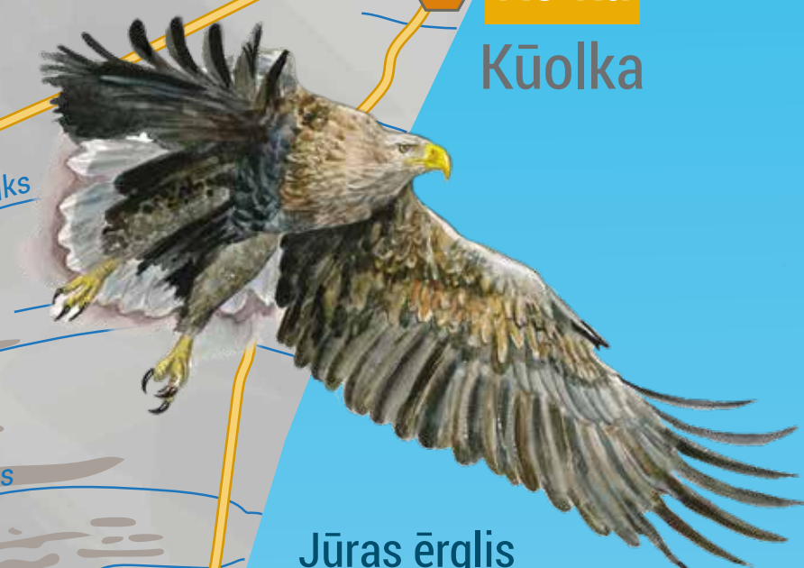
Jūras ērglis Haliaeetus albicilla