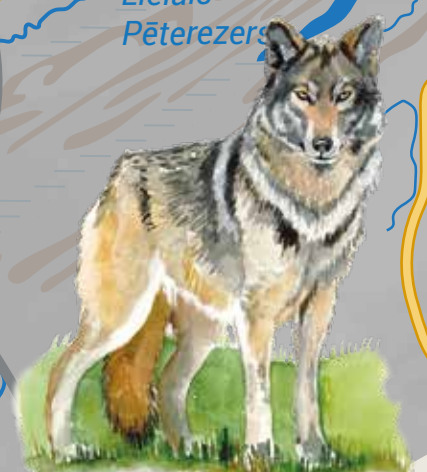
Pelēkais vilks Canis lupus