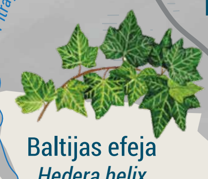
Baltijas efeja Hedera helix