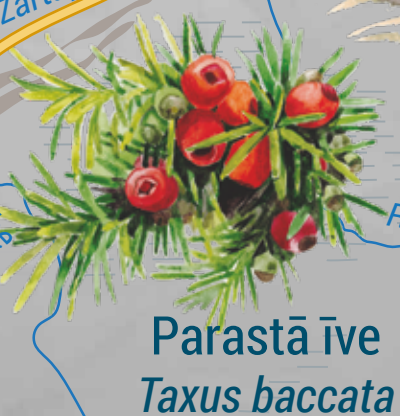
Parastā īve Taxus baccata