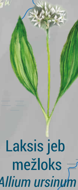
Laksis jeb mežloks Allium ursinum