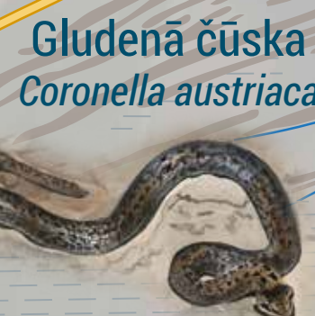
Gludenā čūska Coronella austriaca