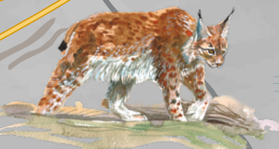
Lūsis Lynx lynx