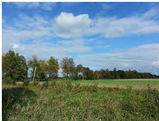
4. attēls. Skats uz Bukaišu aleju no Ukru gāršas puses. Foto: Evita Oļehnoviča, 2016.