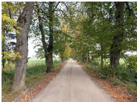
3.attēls. Bukaišu aleja virzienā uz Ukru gāršu tās beigu daļā. Foto: Evita Oļehnoviča, 2016.

Otra aleja izvietota gar zemes ceļu virzienā uz Ukru gāršu. Aleju pamatā veido lielu dimensiju kastaņas un liepas, aleja kopumā ļoti ainaviska (3. - 4.attēls). Alejā ir koki ar dobumiem, kā arī stumbeņi, dažiem kokiem – deguma rētas. Alejai piegulošās teritorijas pamatā veido lauksaimniecības zemes un lauku viensētas, alejas sākumdaļā privātmāju apbūve.