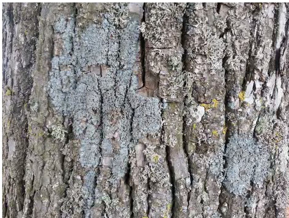
5. attēls. Aizsargājamā ķērpju suga Pleurosticta acetabulum Bukaišu alejā virzienā uz Ukru gāršu. Foto: Evita Oļehnoviča, 2016.

Bukaišu alejā nav konstatētas īpaši aizsargājamās sūnu sugas. Alejā atzīmētas 2 īpaši aizsargājamās ķērpju sugas bālā sklerofora Sclerophora pallida (1 atradne) un kausveida pleurostikta Pleurosticta acetabulum (6 atradnes). Sclerophora pallida atzīmēta uz viena koka alejā virzienā uz Ukru gāršu, atradne ir niecīga un ir maznozīmīga no sugas saglabāšanas viedokļa ilgtermiņā.