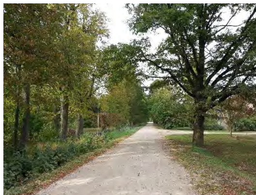
2. attēls. Bukaišu alejas I teritorija tās beigu daļā. Foto: Evita Oļehnoviča, 2016.