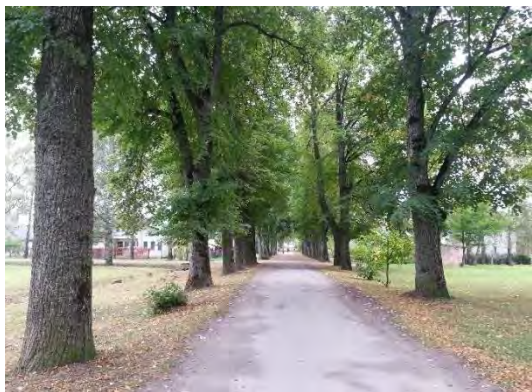
1.attēls. Bēnes aleja, skats no Bēnes muižas puses. 2016.

Bēnes alejas shēma un robežu apraksts dots 22.11.2005. MK noteikumu Nr.888 “Noteikumi par aizsargājamām alejām” 12. pielikumā. Bēnes aleja izvietota Bēnes ciema Stacijas ielā, tā sākas pie Stacijas ielas krustojuma ar Jelgavas –Auces šoseju (2. attēls) un ved virzienā uz Bēnes muižu (1. attēls).