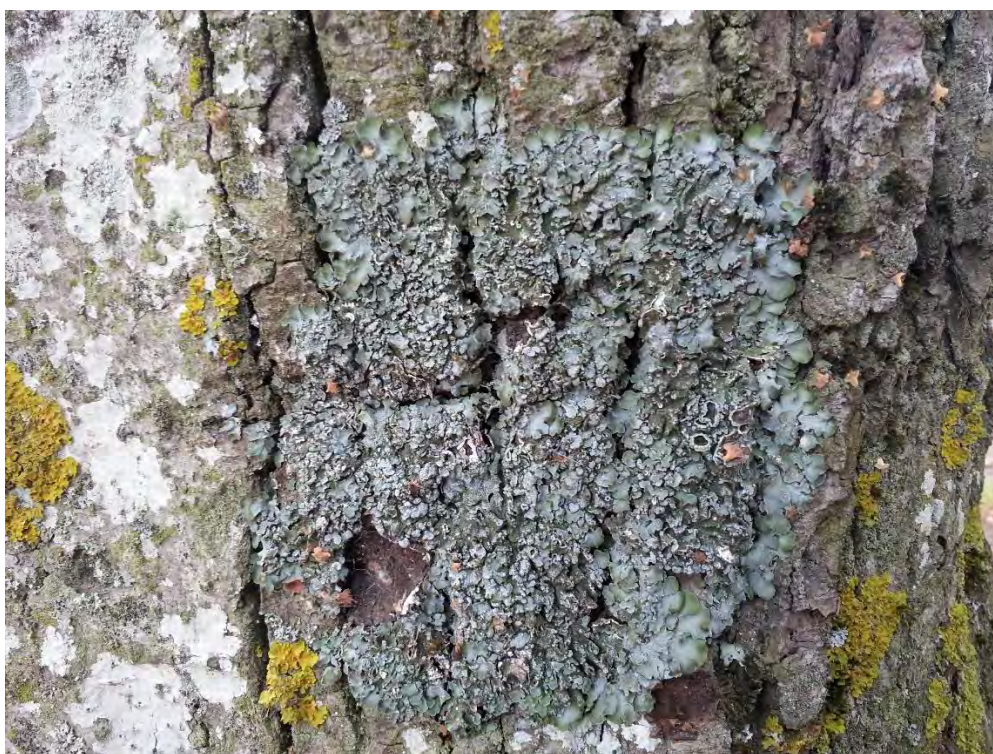
3.attēls. Kausveida pleurosticta Pleurosticta acetabulum uz liepas Bēnes alejā.

Bēnes alejā nav konstatētas īpaši aizsargājamās sūnu sugas. Alejā konstatēta viena īpaši aizsargājamā ķērpju suga kausveida pleurostikta Pleurosticta acetabulum (4 atradnes). Sugas atradņu skaits nav liels, tomēr tās ir labā stāvoklī (3. attēls) un sugai alejā ir labas izplatīšanās iespējas – esošo atradņu tuvumā ir citi potenciāli piemēroti dzīvotnes koki (alejās liepas).