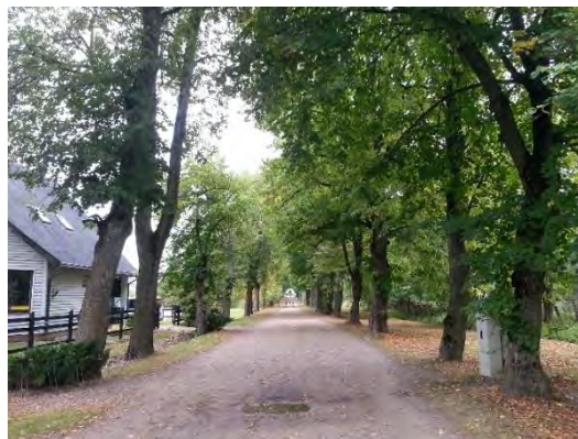
2.attēls. Bēnes aleja. Skats no Jelgavas –Auces šosejas puses. Foto: Evita Oļehnoviča, 2016.