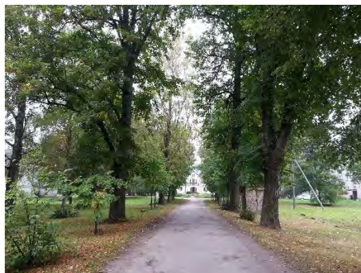
5.attēls. Bēnes muiža, skats no alejas. Foto: Evita Oļehnoviča, 2016.

Bēnes muižas parks un alejas noteiktas kā aizsargājams dabas piemineklis arī pirms 1940. gada, kad tā ar valdības 1926. gada 3. februāra rīkojumu iekļauta sarakstā Nr. 8 aizsargu mežiem, parkiem, alejām un dabas pieminekļiem.