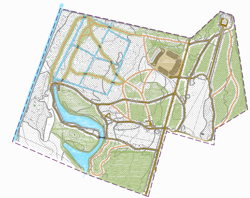
1 reizi gadā plaujamais zāliens (14563 m 2 )