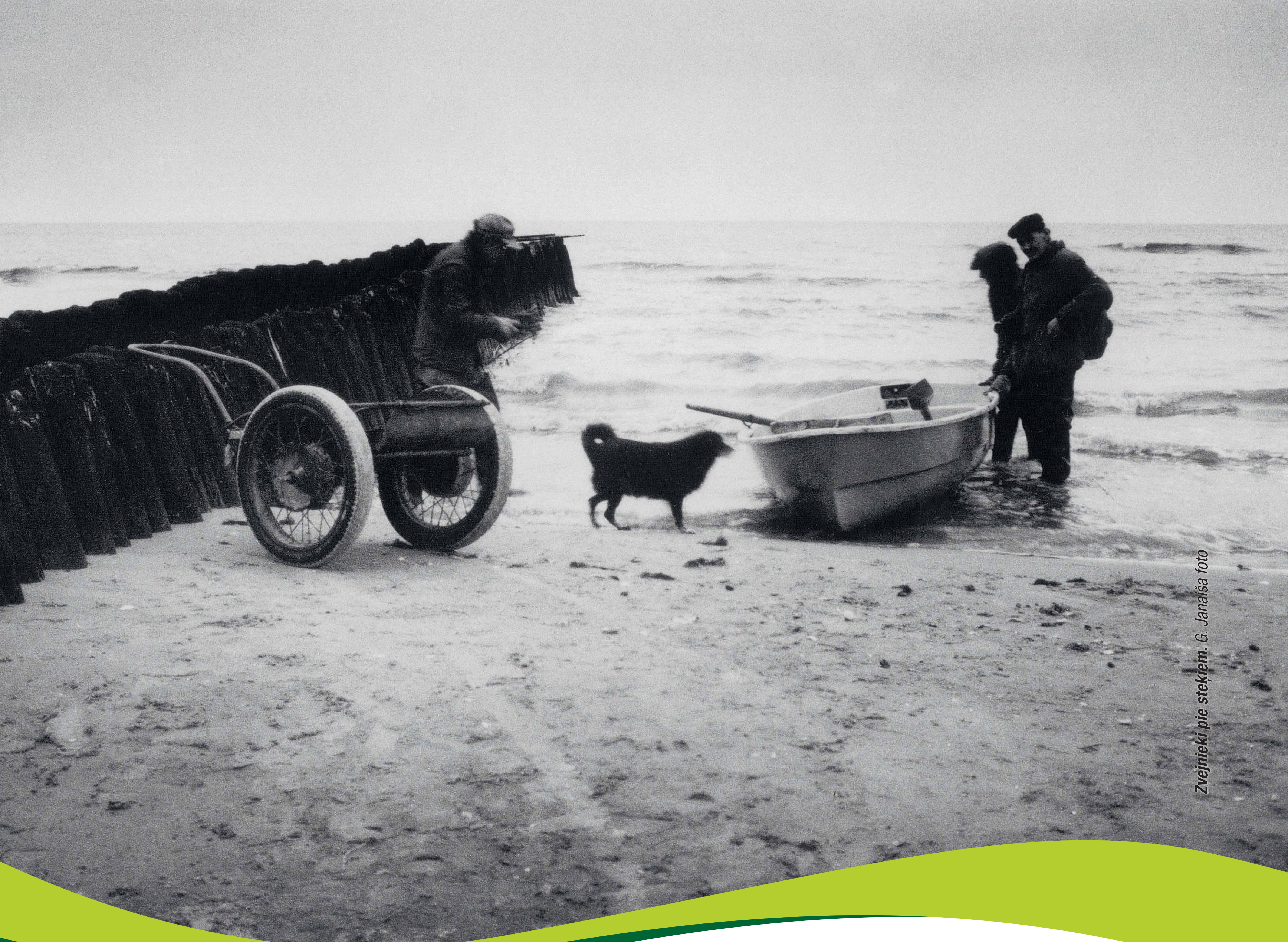
Zvejnieki pie stekļiem.