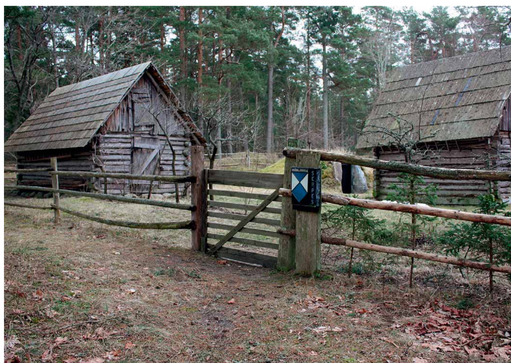
Līvu sēta.