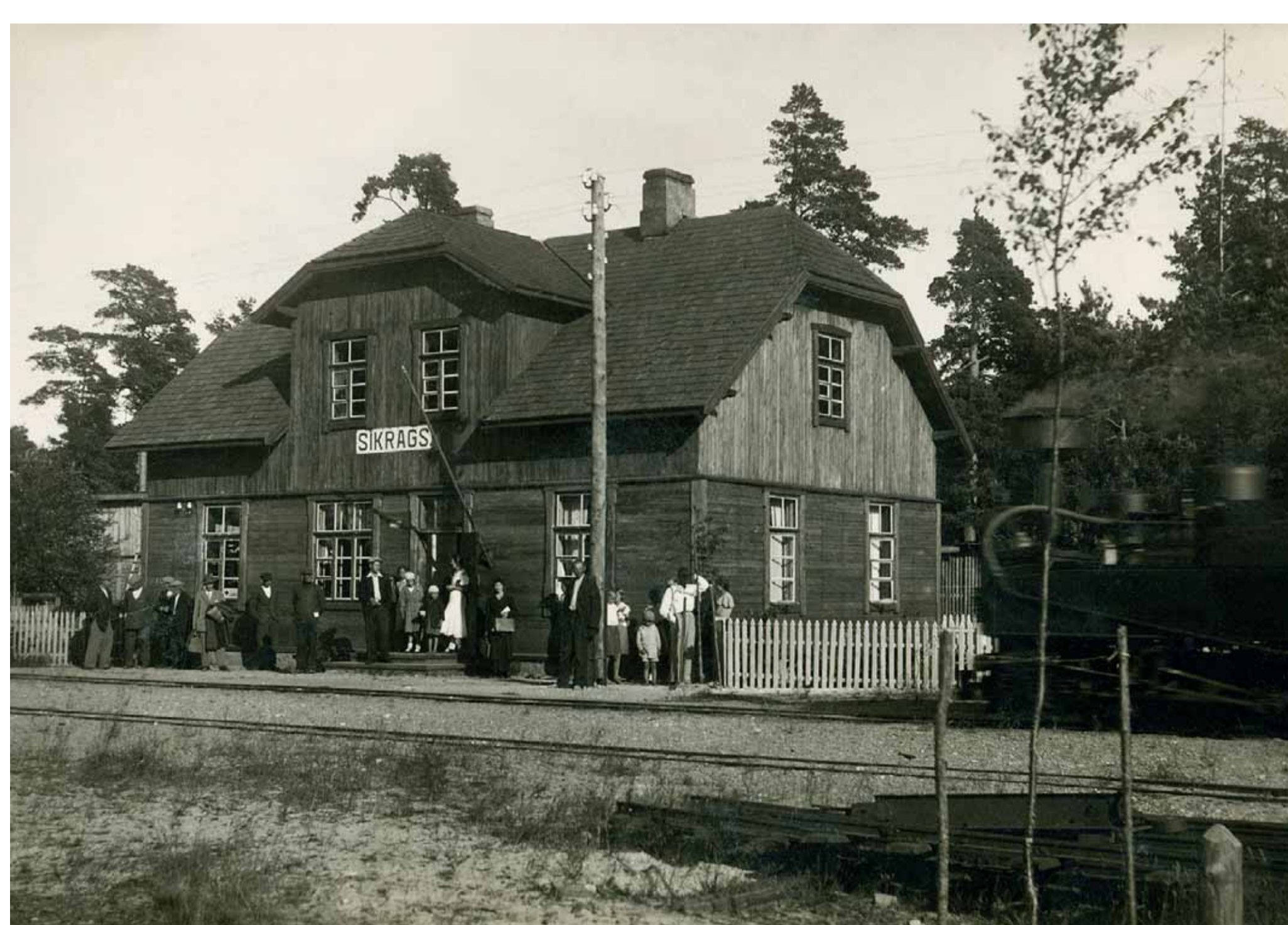
Sikraga stacija 20. gs. 30. gados.