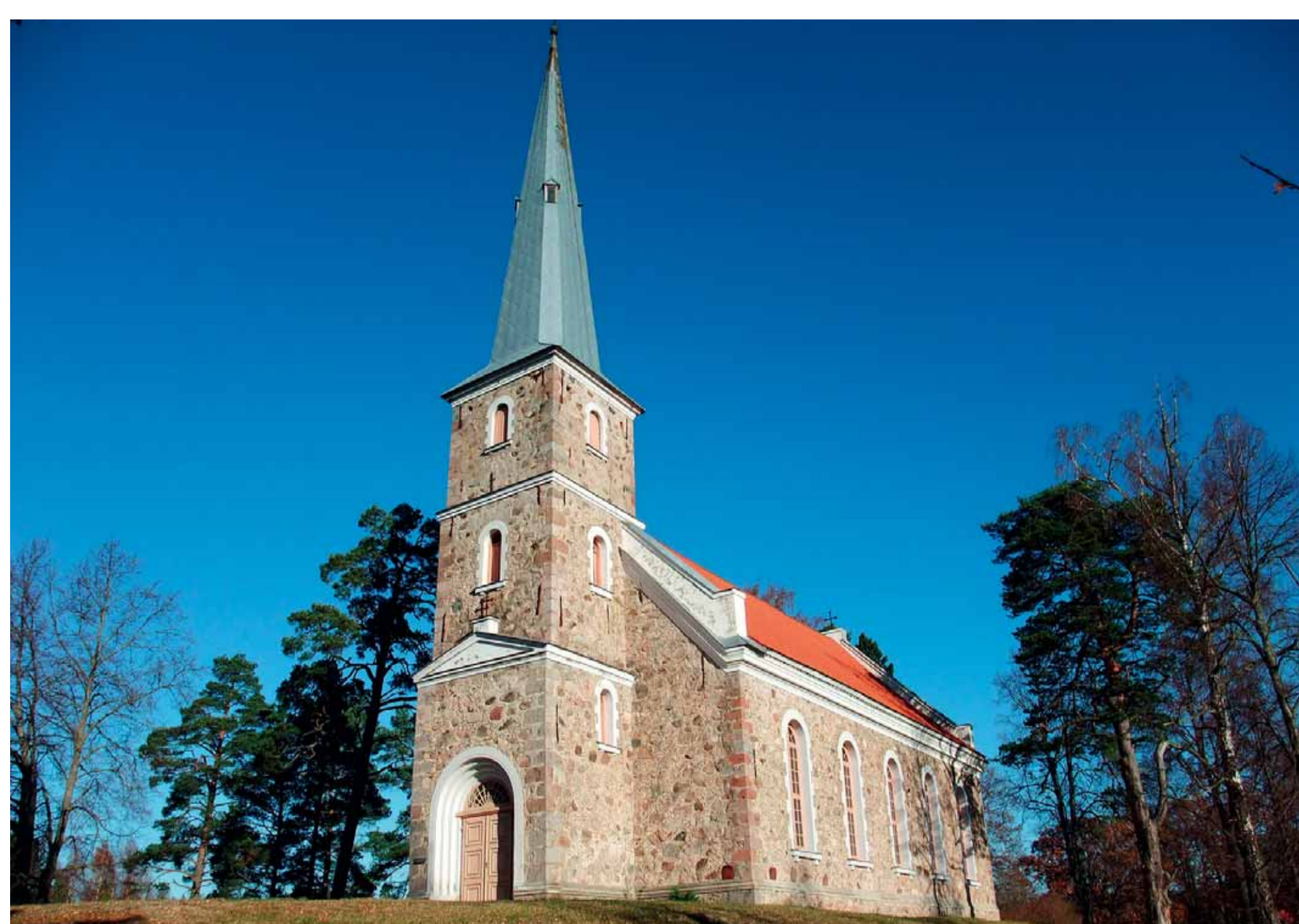
Mazirbes baznīca.