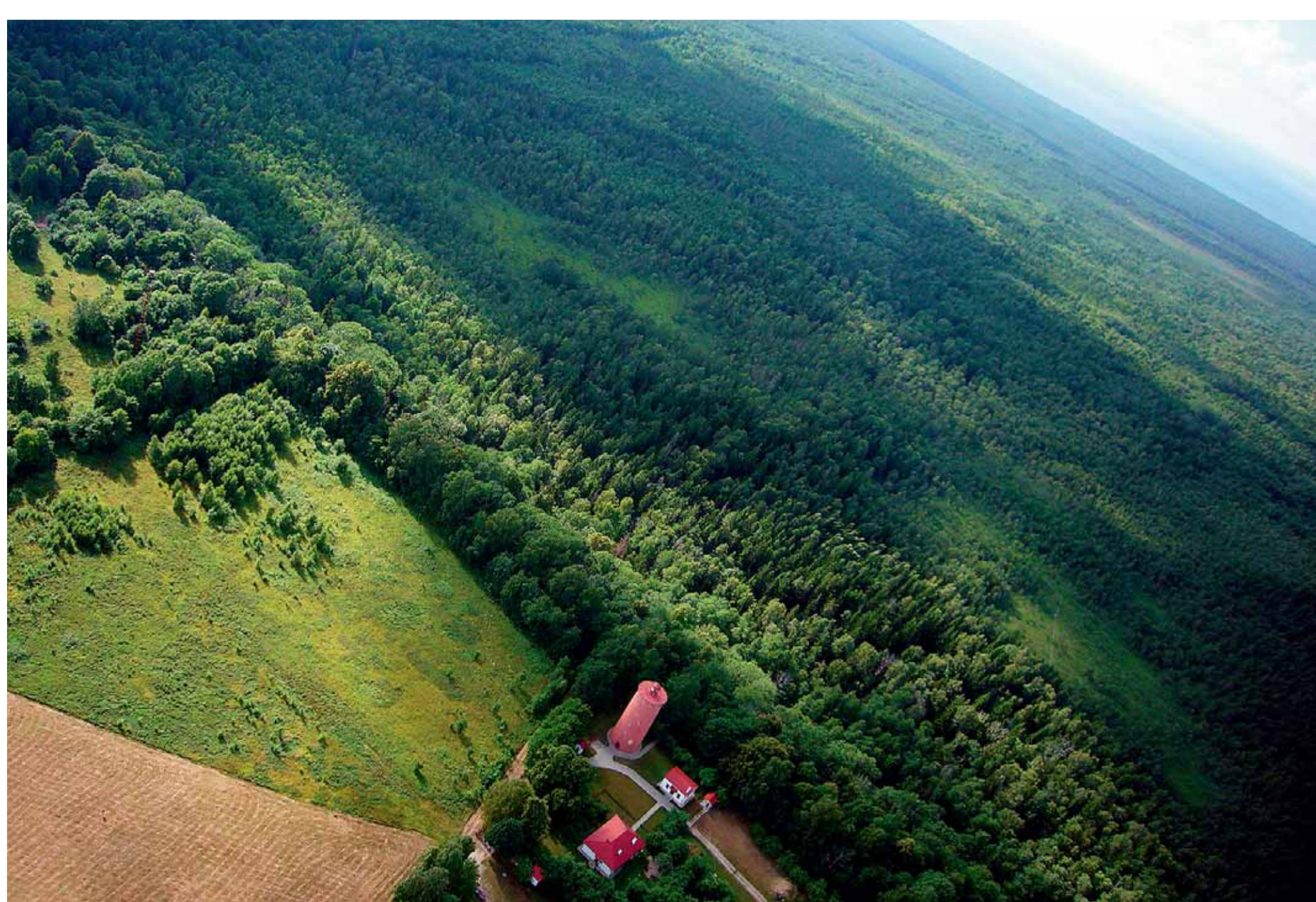
Skats uz SNP no Šlīteres Zilo kalnu puses.