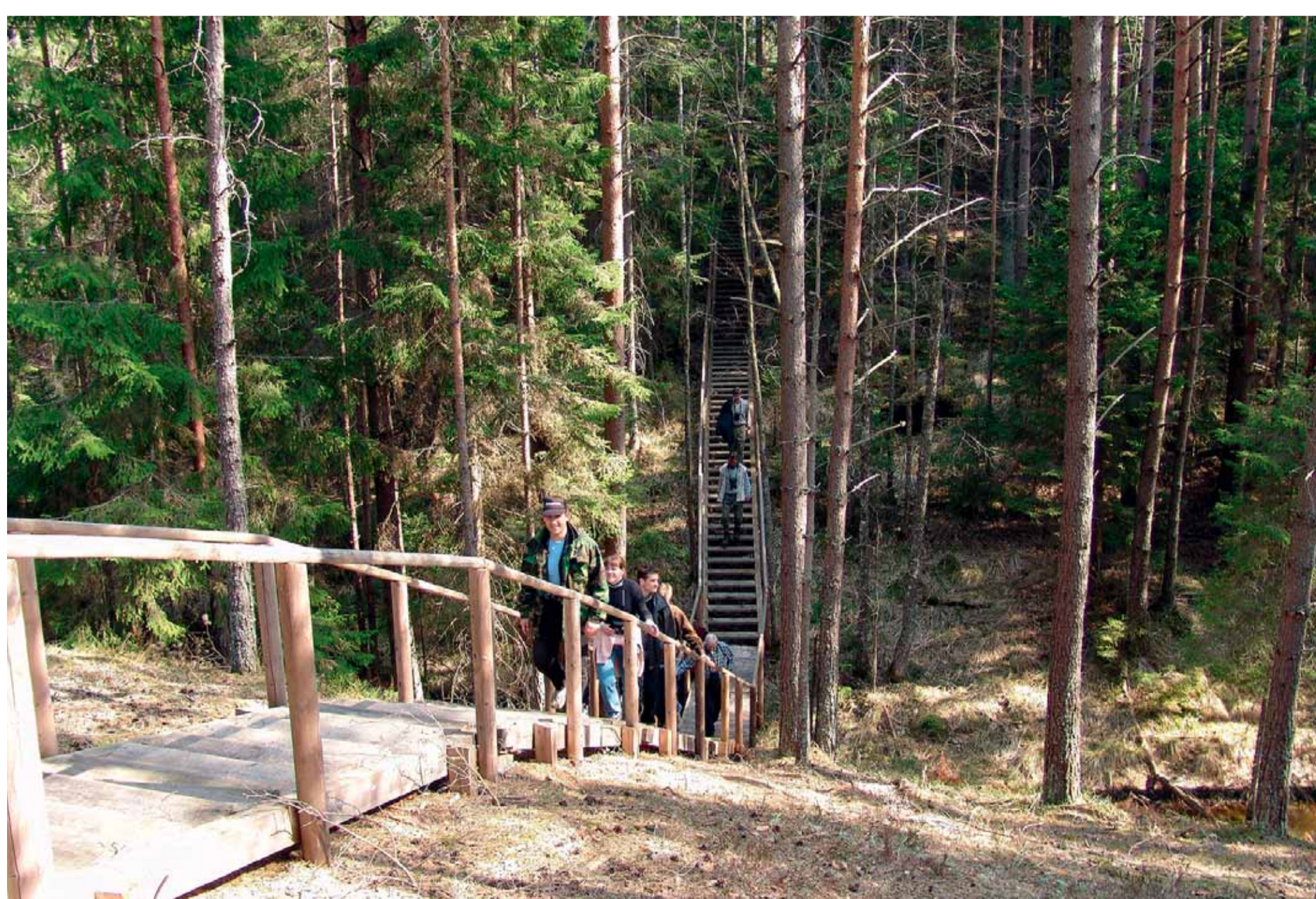
Viena no pirmajām dabas takām ved pāri kangariem un vigām.