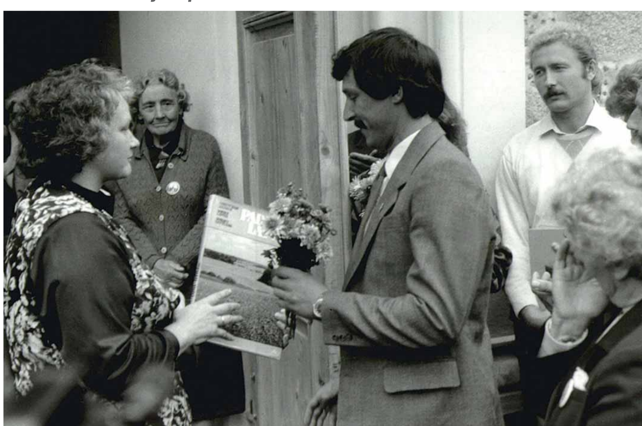
Slīteres darbinieki 20. gs. 80. gados.

2000. gada 16. martā stājās spēkā «Likums par Slīteres nacionālo parku». Pašlaik Slīteres nacionālais parks aizņem 16 360 ha sauszemes teritorijas un 10 130 ha jūras akvatorijas. Nacionālais parks ir īpaši aizsargājama dabas teritorija, kura kalpo ne tikai dabas aizsardzībai un izpētei, bet arī sabiedrības rekreācijai un dabas izglītībai. Slīteres nacionālā parka lielākā daļa ir brīvi apmeklējama. Izņēmums ir rezervāta zonas, kas vēl joprojām glabā lielākos dabas retumus, tāpēc tūristiem tās nav pieejamas. Apmeklētājus Slīterē gaida četras dabas takas ar informāciju par tajās sastopamajām dabas vērtībām, Slīteres bāka, vairāki velomaršruti. Automašīnas iespējams novietot stāvlaukumos gan jūras piekrastē, gan pie takām. Unikāla ir Latvijas senās pamattautas — lībiešu — kultūrvēsture, kura vērojama piekrastes zvejniekiem arhitektūrā, ciemu plānojumā, nelielajos muzejos un etnogrāfisko priekšmetu kolekcijās.