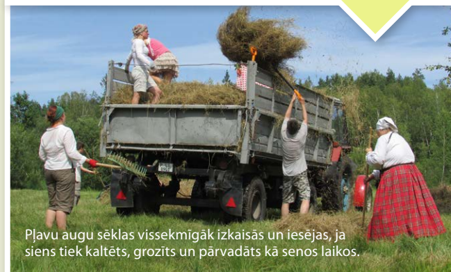
Pļavu augu sēklas vissekmīgāk izkaisās un iesējas, ja siens tiek kaltēts, grozīts un pārvadāts kā senos laikos.

Nopļautā zāle vai siens jāsavāc , bet to labāk darīt, lai paspēj izbirt augu sēklas. Ja siens netiek savākts vai zāle smalcināta, dažu gadu laikā tas rada pārmēslošanās efektu – sarūk augu daudzveidība un ieviešas ekspansīvas sugas, no kurām grūti atbrīvoties.