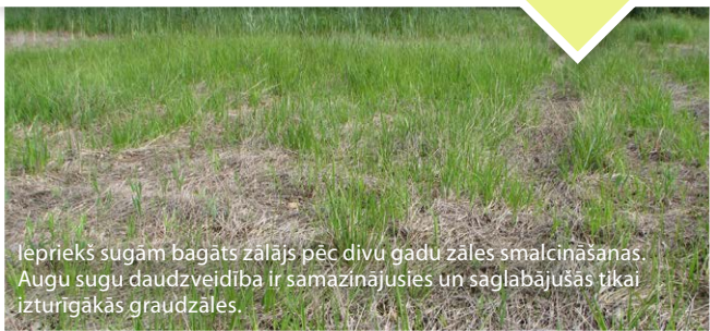
Iepriekš sugām bagāts zālājs pēc divu gadu zāles smalcināšanas. Augu sugu daudzveidība ir samazinājusies un saglabājušās tikai izturīgākās graudzāles.

Iekultivēšana, mēslošana, pļaušana vairākreiz gadā, pārgaņšana, smalcināšana un nopļautās zāles nesavākšana, pārāk vēla pļaušana, ikgadēja kūlas dedzināšana, nepiemērotas traktortehnikas izmantošana degradē dabiskos zālājus.