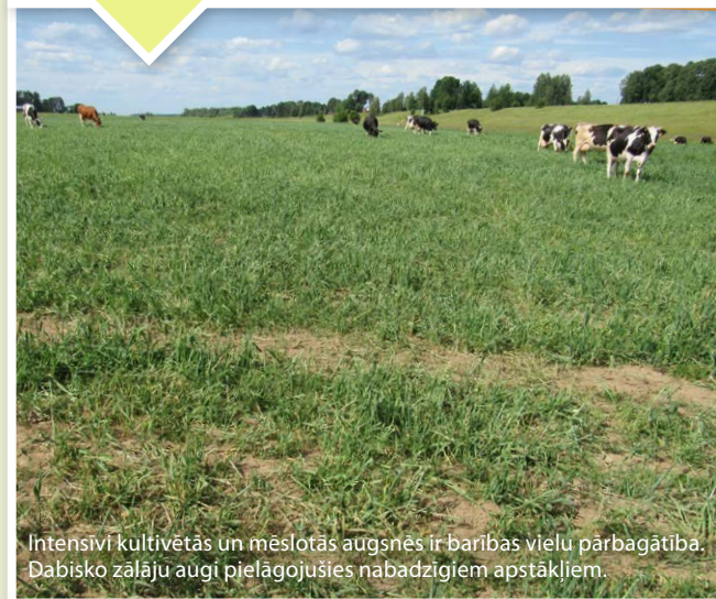
Intensīvi kultivētās un mēslotās augsnēs ir barības vielu pārbagātība. Dabisko zālāju augi pielāgojušies nabadzīgiem apstākļiem.

Turpinot apsaimniekot zālāju, pļaujot un reizi gadā savācot sienu vai noganot , ar laiku sugu sastāvs kļūs daudzveidīgāks. Tomēr intensīvas lauksaimniecības vai mežainos apvidos, kur dabisko zālāju ir maz un tālu cits no cita, dabisko zālāju sugas var ieviesties lēni vai nekad.