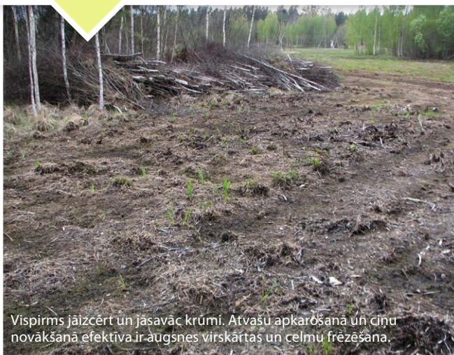
Vispirms jāizcērt un jāsavāc krūmi. Atvašu apkarošana un ciņu novākšana efektīva ir augsnes virskārtas un celmu frēzēšana.

Vēlams saglabāt atsevišķus kokus – īpaši, ja tie ir veci, lieli vai īpatnējas formas, kā arī vismaz dažus krūmu pudurus, tomēr lielākajai zālāja daļai jābūt klajai.