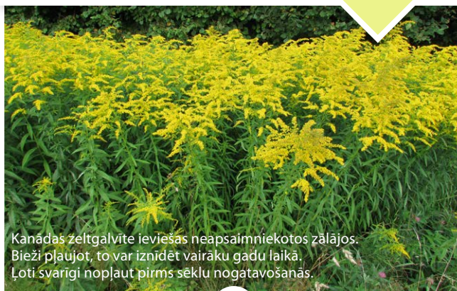
Kanādas zeltgalvīte ieviešas neapsaimniekotos zālajos. Bieži pļaujot, to var iznīdēt vairāku gadu laikā. Ļoti svarīgi nopļaut pirms sēklu nogatavošanās.

Latvijā invazīvās augu sugas ( ej.uz/invazivi ), kas ieviešas zālajos, ir Kanādas zeltgalvīte, Sosnovska latvānis, puķu sprigane, dzeloņainais gurķis, blīvā skābene u.c. To sēklas un sakņu fragmenti atceļo pa upēm, autoceļiem, ar vēja palīdzību. Invazīvās sugas lielākoties atpazīstamas pēc lielā auguma, tās mēdz veidot blīvas audzes un ir grūti iznīdējamas. Jo agrāk sāk ar tām cīnīties, jo labākas sekmes.