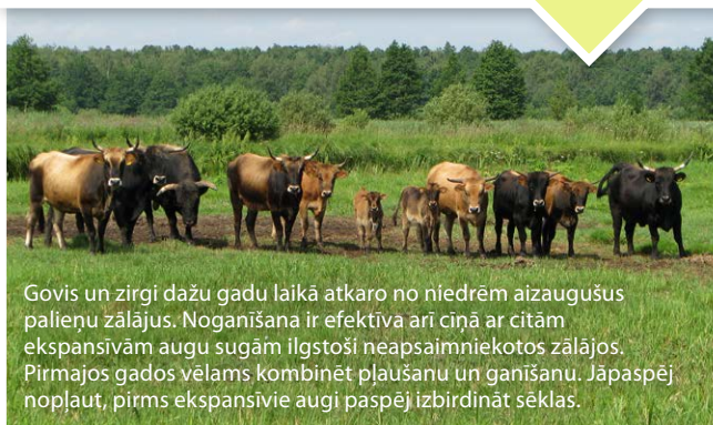
Govis un zirgi dažu gadu laikā atkaro no niedrēm aizaugušus palienu zālajos. Noganišana ir efektīva arī ciņā ar citām ekspansīvām augu sugām ilgstoši neapsaimniekotos zālajos. Pirmajos gados vēlams kombinēt pļaušanu un ganišanu. Jāpaspēj nopļaut, pirms ekspansīvie augi paspēj izbīdināt sēklas.

Bieža pļaušana pirmajos gados, ko vēlams kombinēt ar noganišanu , ir efektīva krūmu atvašu un ekspansīvo augu sugu mazināšanā. Piemēram, ar niedrēm aizaugušos palienu zālajos efektīva ir pļaušana divreiz gadā, atālu noganot.