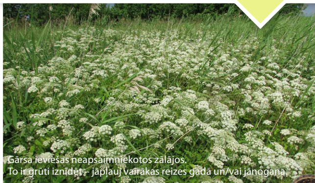
Gārša ieviešas neapsaimniekotos zālajos. To ir grūti iznīdēt – jāpļauj vairākas reizes gadā un/vai jānogana.

Dabiskos zālājus degradē pārlietu liels barības vielu daudzums augsnē – tās ieplūst no tuvējām intensīvi mēslotajām aramzemēm un ar palu ūdeņiem no upēm. Zālāji “pārbarojas”, sadaloties nosusinātai kūdrai bijušajos zāļu purvos. Arī slāpekļa piesārņojums no gaisa nonāk augsnē. Pārāk liels barības vielu daudzums izraisa zālāja aizaugšanu ar ekspansīvām augu sugām. Samazinās sugu daudzveidība, izzūd dabiskiem zālājiem raksturīgie augi.