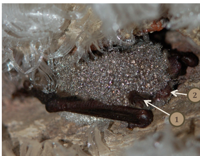
Aprasojis ūdeņu naktssikspārnis.