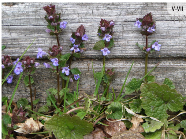
Glechoma hederacea EFEJU SĒTLOŽŅA