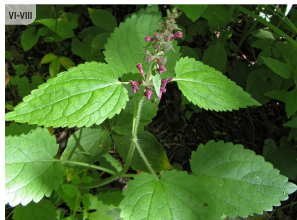
Stachys sylvatica MEŽA SĀRMENE