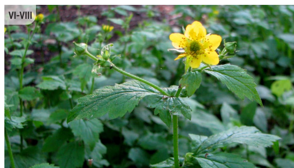
Geum urbanum PILSĒTAS BITENE