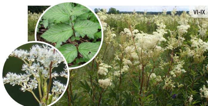
Filipendula ulmaria PARASTĀ VĪGRIEZE