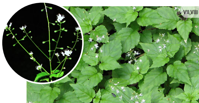
Circaea alpina ALPU RAGANZĀLĪTE