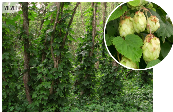
Humulus lupulus PARASTAIS APINIS