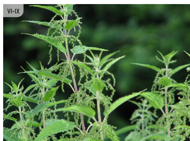
Urtica dioica LIELĀ NĀTRE