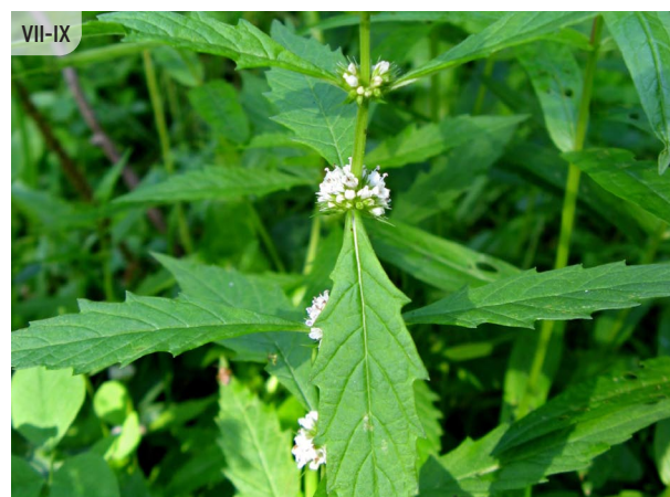
Lycopus europaeus EIROPAS VILKNADZE