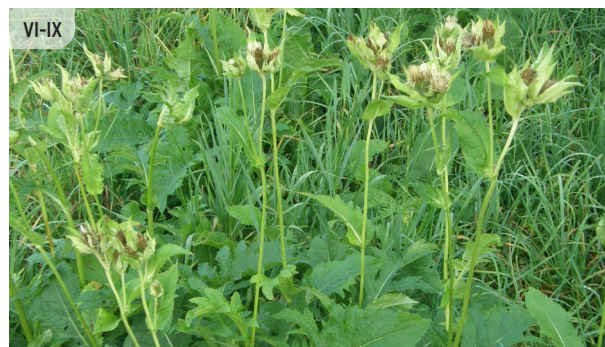
Cirsium oleraceum LĒDZERKSTE