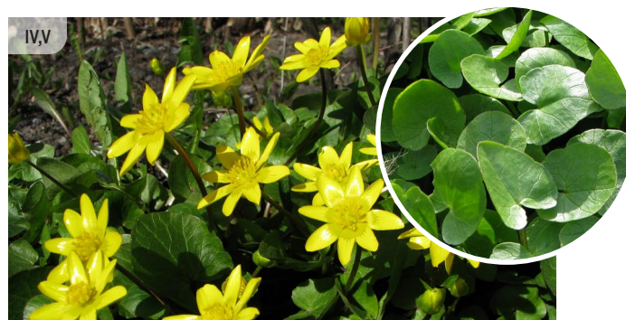
Ficaria verna PAVASARA MAZPURENĪTE