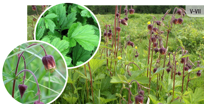
Geum rivale PĻAVAS BITENE