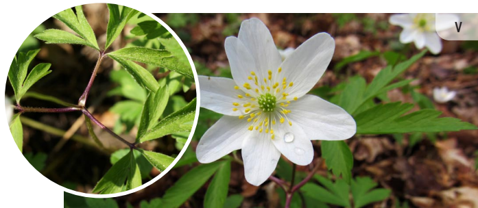
Lapas uz īsa kāta