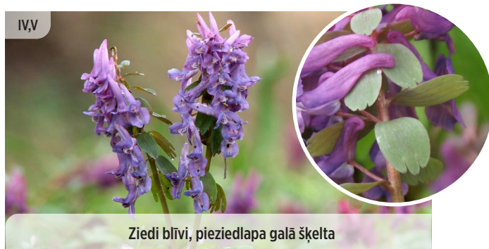
Ziedi blīvi, pieziedlapa galā šķelta