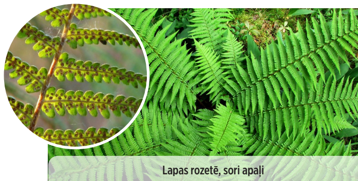
Lapas rozetē, sori apāļi

Dryopteris filix-mas MELNĀ OZOLPAPARDE (VĪRPAPARDE)