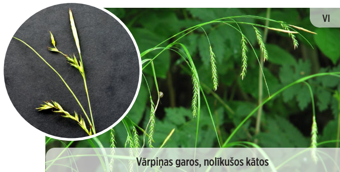
Vārpiņas garas, nolīkušos kātos