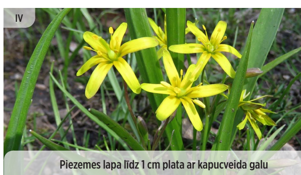
Piezemes lapa līdz 1 cm plata ar kapucveida galu

Dryopteris filix-mas MELNĀ OZOLPAPARDE (VĪRPAPARDE)