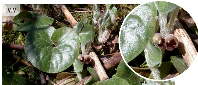
Lapas ziemzaļas, sarkanbrūnais zieds ļoti īsā kātā