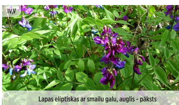
Lapas eliptiskas ar smailu galu, auglis - pāksts