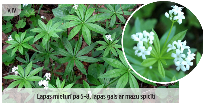
Lapas mieturī pa 5-8, lapas gals ar mazu spicīti

Galium odoratum SMARŽĪGĀ MADĀRA (MIEŠĶIS)