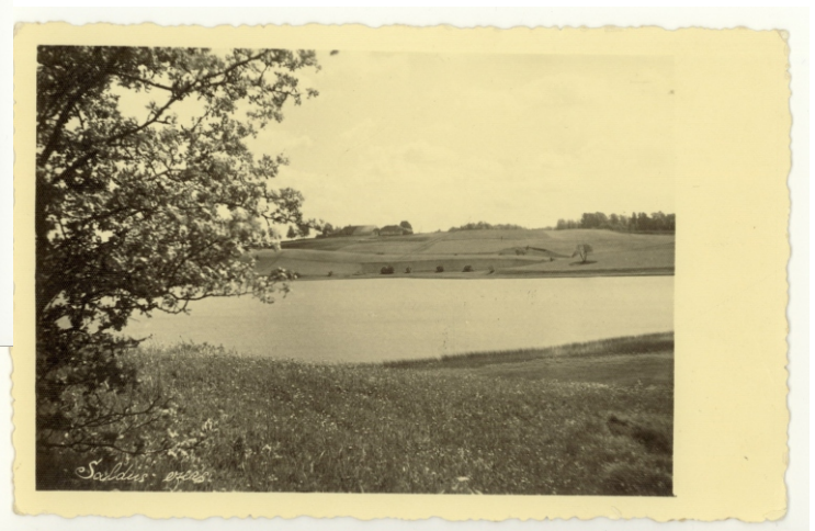
Saldus ezers. 20. gs. 30. gadi.