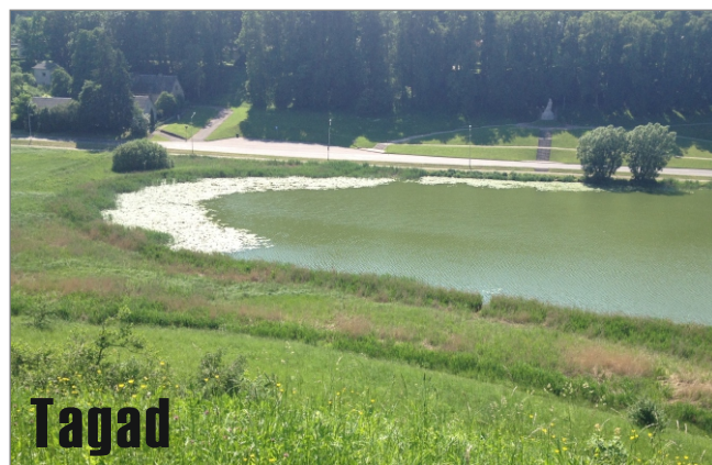
Talsu ezers. 2013. gads.