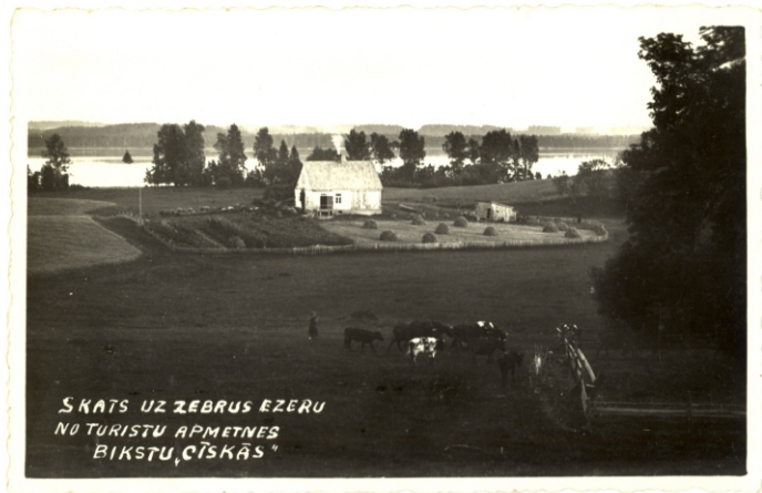
SKATS UZ ZEBRUS EZERU NO TURISTU APMETNES BIKSTU ČĪSKAS