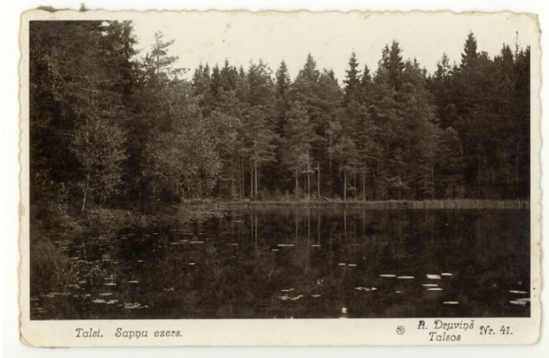
Talsi. Sappu ezers.