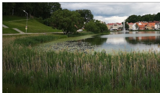
Talsu ezers. 2022. gads.

Senajās fotogrāfijās redzamais liecina, ka Talsu ezerā jau 20. gs. 30. gados bija uzkrājušās augu barības vielas, par ko liecina blīvas virsūdens augu joslas izveidošanās. To veido platlapaini virsūdens augi, kas varētu būt ežgalvītes, vilkvāļītes vai kalmes. Ūdenī iegremdēto augu josla ir izveidojusies tikai ezera galā, augu blīvums tajā ir neliels.