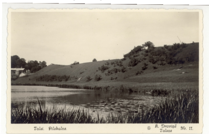
Talsu ezers. 20. gs. 30. gadi.