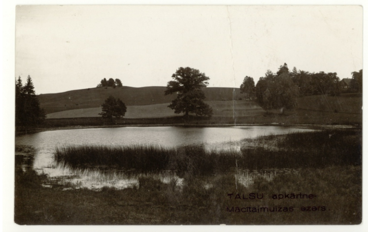
TALSU apkārtnē Mācītājmuižas ezers