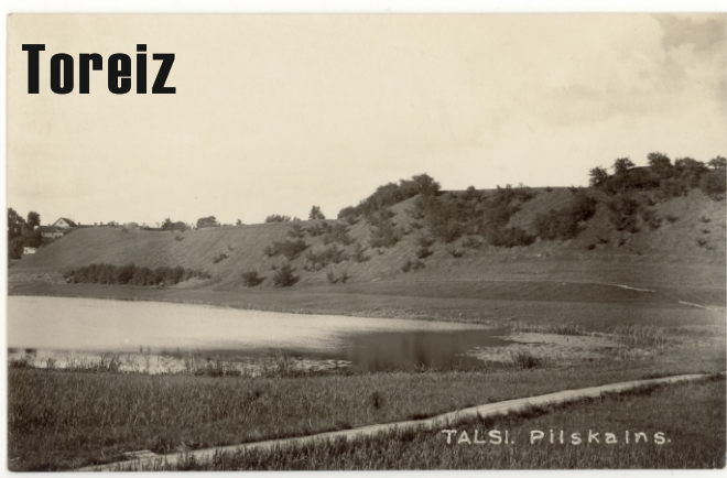
Talsu ezers. 20. gs. 30. gadi.

Par ezera stāvokli 20. gadsimtā un cilvēka saimniekošanas veidu tajā laikā var uzzināt no senajām fotogrāfijām. Salīdzinot tās ar mūsdienās iegūtajām, var redzēt, kā ir mainījies ezera stāvoklis un cilvēku saimniekošana ezera apkārtnē. Aplūko Talsu ezera salīdzinājumu!