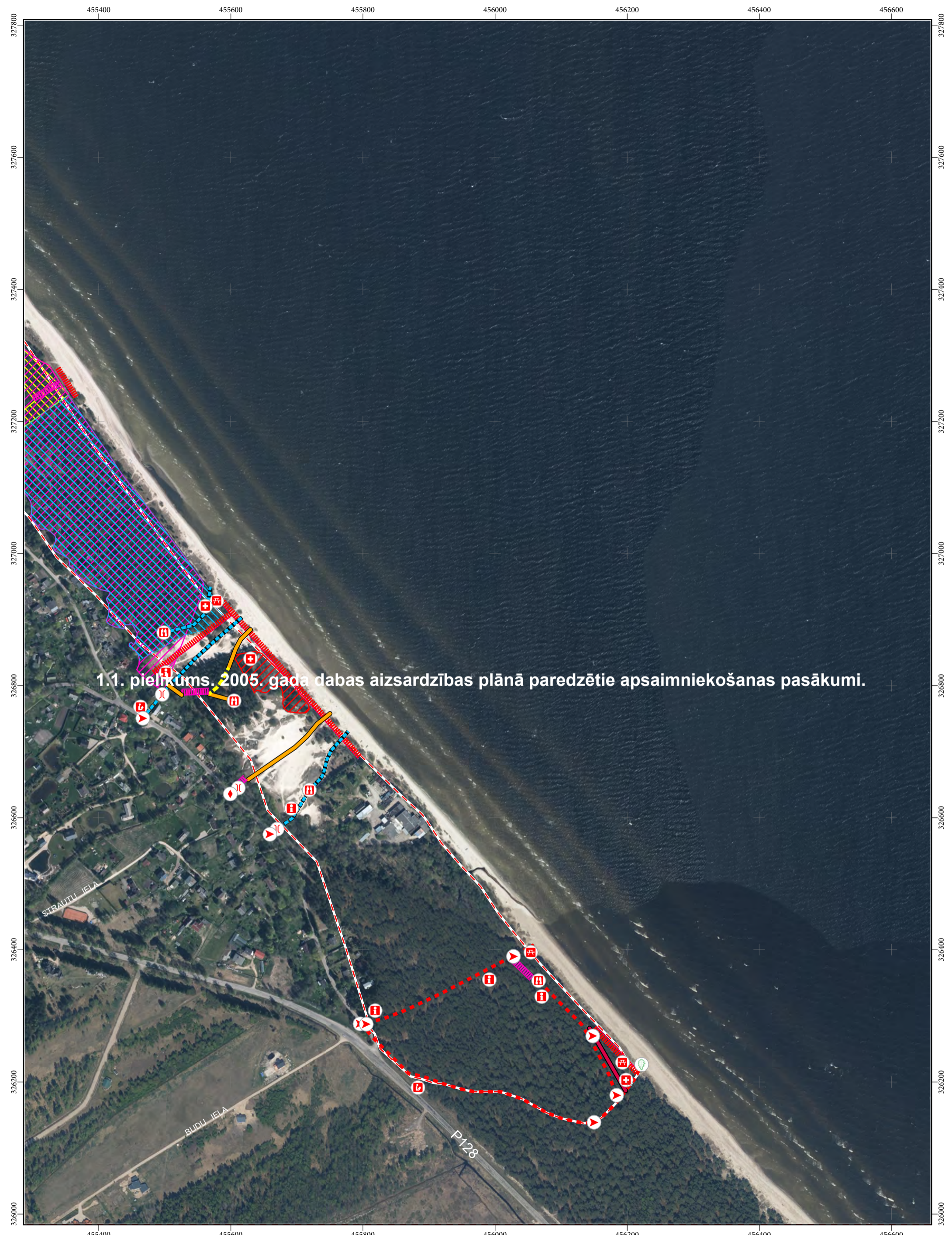
1.1. pielikums. 2005. gada dabas aizsardzības plānā paredzētie apsaimniekošanas pasākumi.