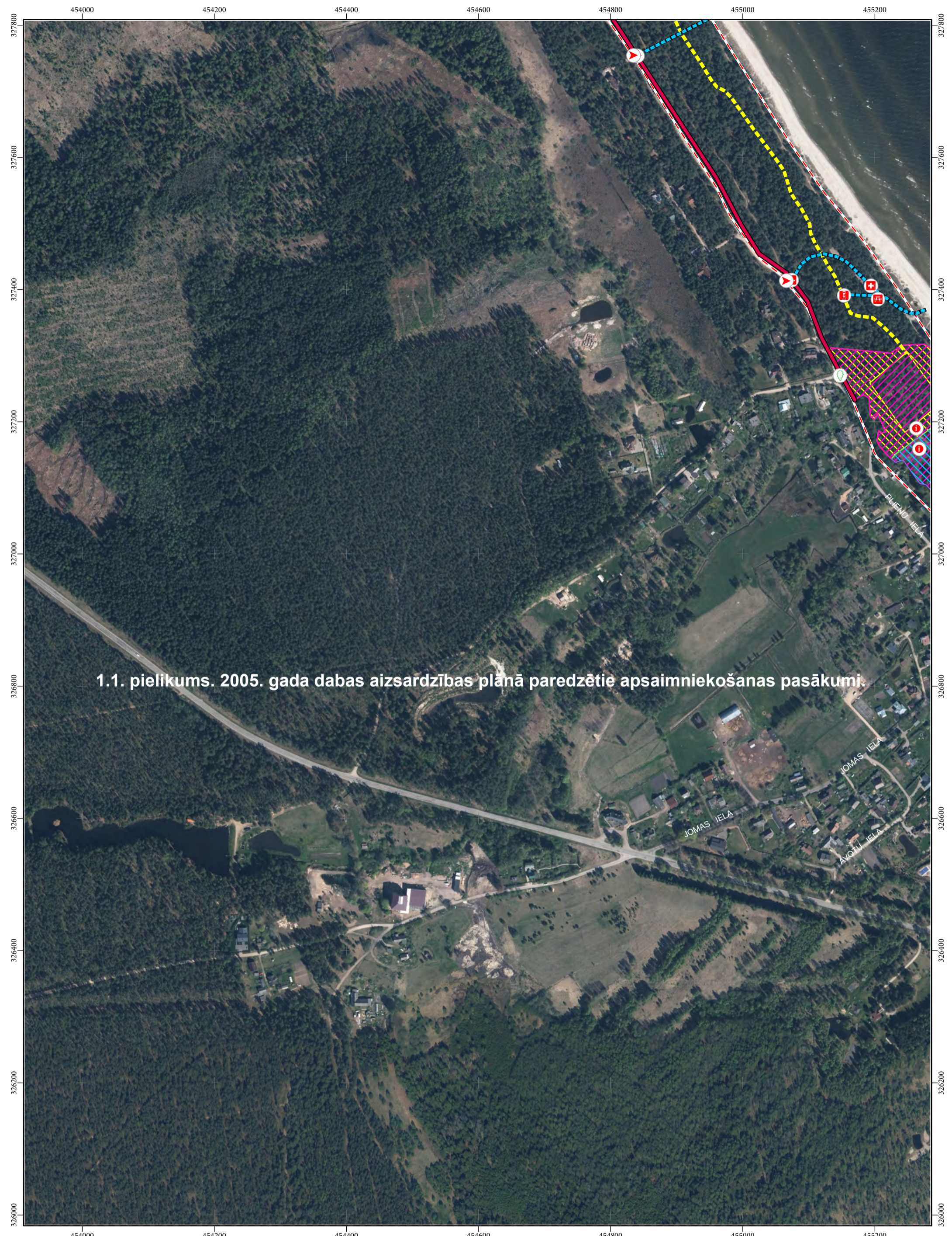
1.1. pielikums. 2005. gada dabas aizsardzības plānā paredzētie apsaimniekošanas pasākumi.