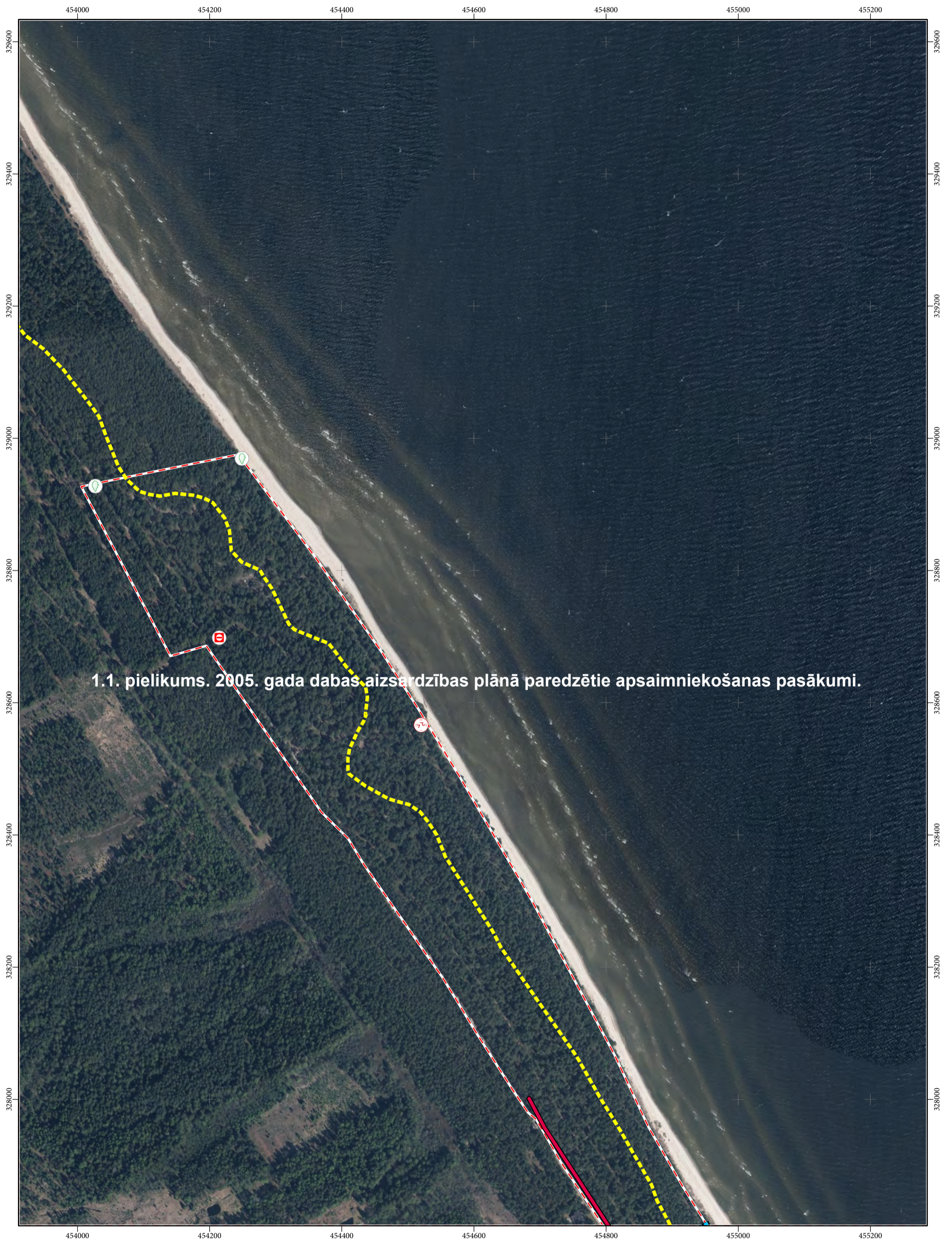
1.1. pielikums. 2005. gada dabas aizsardzības plānā paredzētie apsaimniekošanas pasākumi.